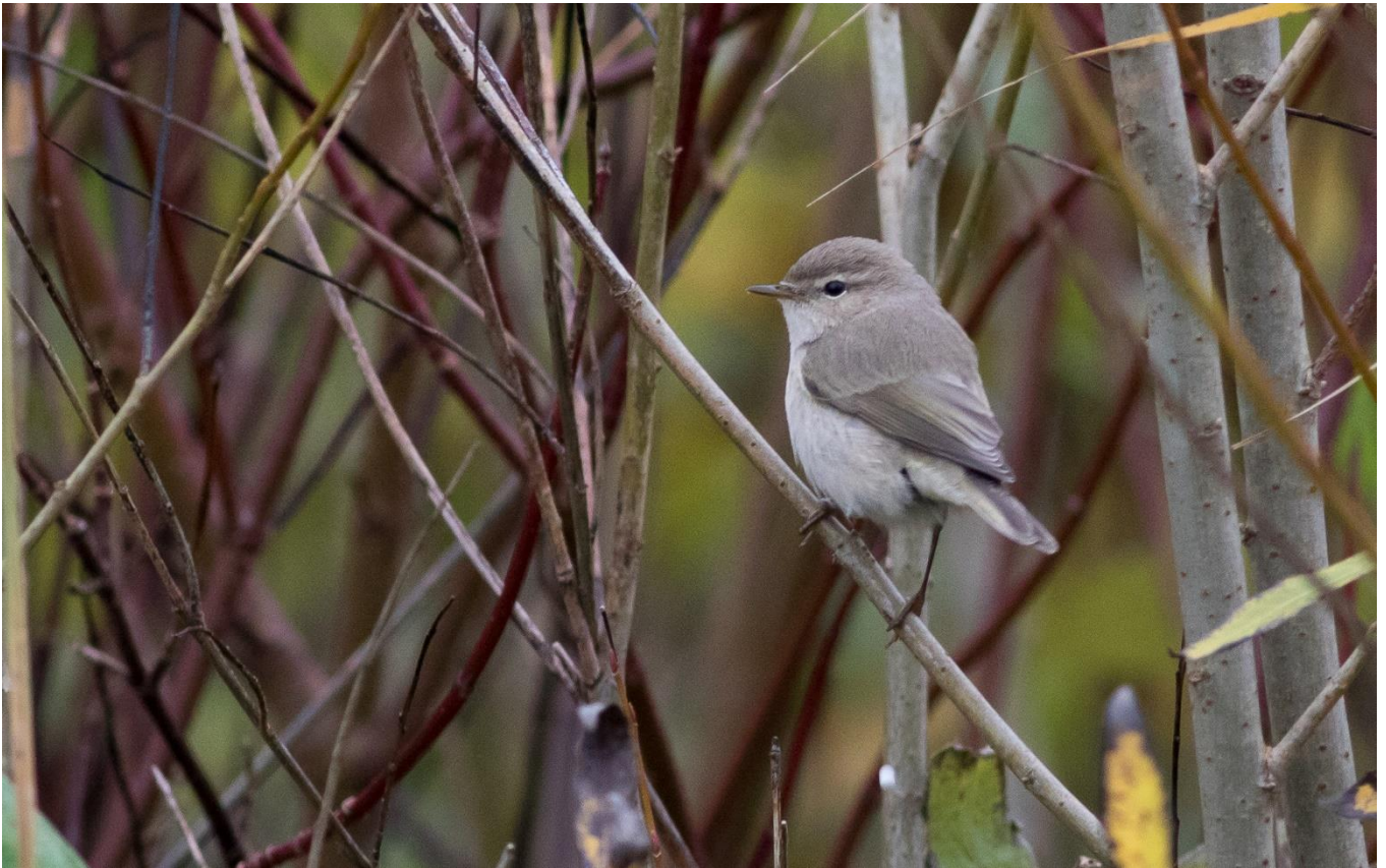
Siberische Tjiftjaf – 11 november 2021 Katwijk aan Zee - Zwarte Pad

Ook november begon nat. Op 1 en op 6 en 7 november stond er daarbij harde wind vanuit het noordwesten. Na de eerste week met veel wind en regen bracht het grootste deel van de maand rustig herfstweer. Vanaf de 20 e draaide de wind naar het noorden en werd het geleidelijk aan kouder. De maande eindigde met twee dagen met opnieuw harde noordwestenwind.