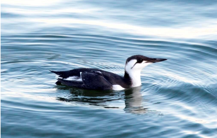
Zeekoet bij de pier van IJmuiden

Zeekoeten en Alken beleefden een moeilijk najaar. Na berichten van grote aantallen gestrande vogels op de Engelse en Schotse kust in september kregen wij dit najaar ook te maken met vogels in problemen. Al vanaf half september waren er opvallende aantallen Zeekoeten aanwezig in zee. Dat deze niet in goede conditie waren bleek toen er dode vogels aanspoelden. De eerste dode Zeekoet spoelde aan op 16 september. Tussen 14 oktober en 7 december volgden er nog 28, met de meeste rond 17 oktober. Alken verschenen later (eerste waarneming 6 oktober) en spoelden in lagere aantallen aan: in totaal 7 tussen 6 november en 17 december. Veel van de gevonden vogels waren al een tijd dood. Er zat dus één of twee weken vertraging tussen het verschijnen van verzwakte vogels voor de kust en het aanspoelen. Daarmee lijkt het dat de