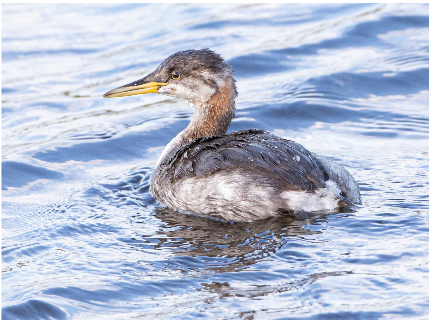
Roodhalsfuut – 29 oktober 2021 Katwijk aan Zee - Binnenwatering

De laatste vlinders van het seizoen waren een Kleine Parelmoervlinder in de Coepelduynen op 26 oktober (JWi) en een Klein Koolwitje op 29 oktober in Noordwijk-binnen (WK)