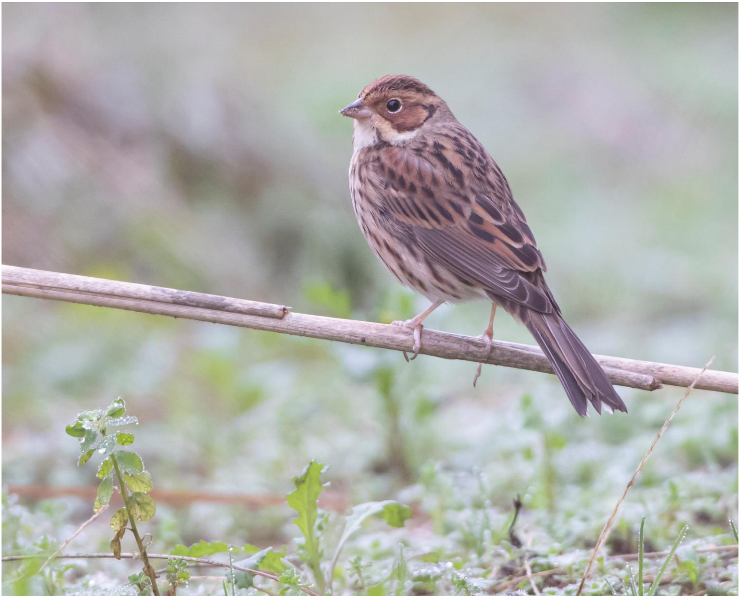
Dweroggors – 27 december 2021 Noordwijk - Willem v.d. Bergh Stichting