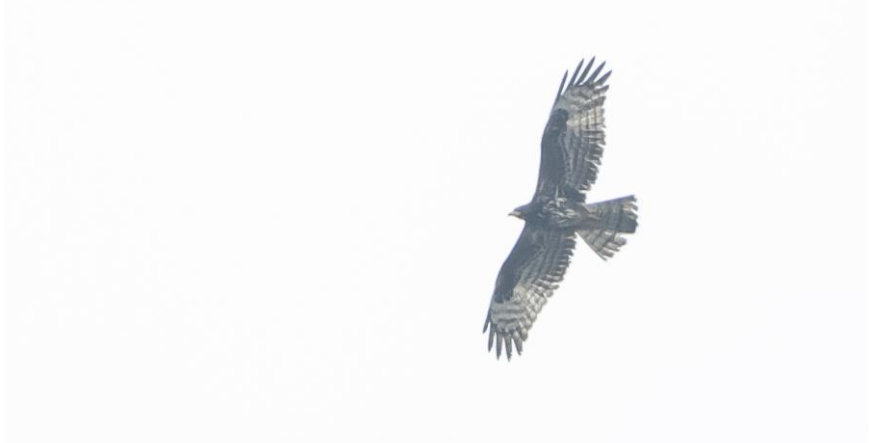
Wespindief – 10 oktober 2021 Katwijk aan Zee - Rijnsoever

Op 2 oktober zat er nog een Grauwe Vliegenvanger in de Noordduinen en ook een Kleine Vliegenvanger (HL). De laatste Bonte Vliegenvanger van het seizoen zat op 5 oktober in Rijnsoever Katwijk (AMe). Een late Sprinkhaanzanger viel op 6 oktober in Rijnsoever ten prooi aan een kat (JVr). Ook laat was de Kwartel die op 23 oktober aanwezig was in de Coepelduynen (JVr). Bladkoningen waren relatief schaars dit jaar. Van 8 t/m 12 oktober was er een doortrekgolfje met een totaal van 14 vogels en een maximum van 5 op 8 okt (CZ ea). Op 31 oktober zat er één in de Coepelduynen (AE). Op 9 oktober dook er een Bruine Boszanger op bij de Duindamse Slag (MW CZ). Een Pallas' Boszanger zat op 16 oktober in de AWD bij de Langevelderslag (RSI). Op 2 oktober trokken er 236 Boomleeuweriken over de Driehoek in de Noordduinen (HL).