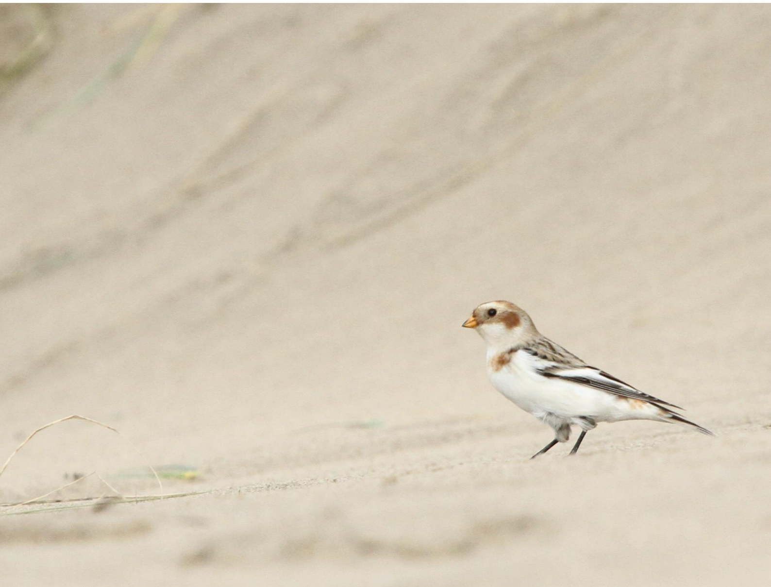
Sneuwgors – 3 november 2021 Noordwijk - Coepelduynen - strand