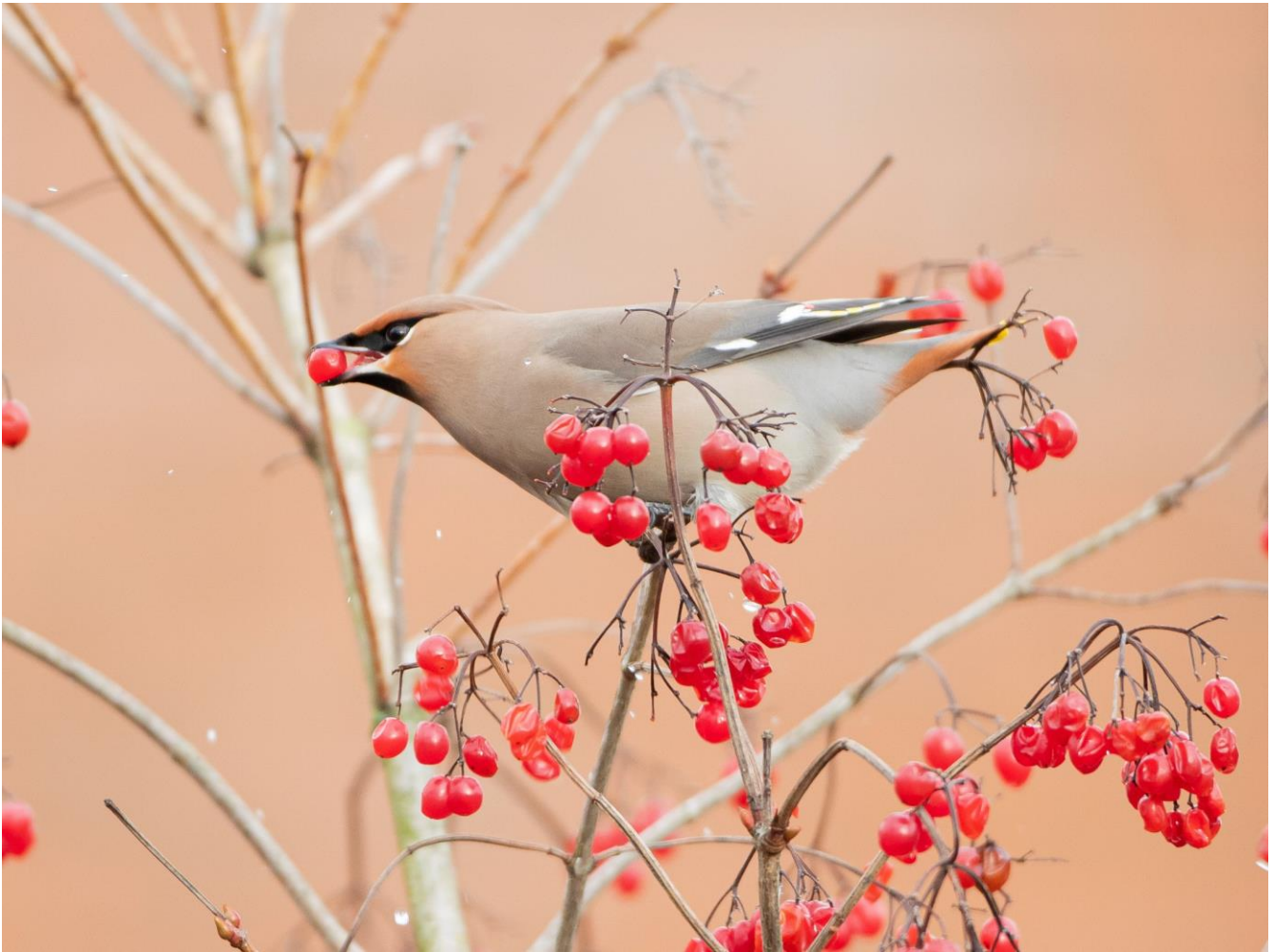
Pestvogel – 28 december 2021 Noordwijk-Binnen - wijk Vinkeveld

De Pestvogel heeft een overeenkomst met de Kuifmees vanwege zijn opvallende kuif. Verder is de Pestvogel de tegenpool van de Kuifmees – zo voorspelbaar als de Kuifmees is, zo onvoorspelbaar is de Pestvogel. Aan het grillige en onvoorspelbare verschijnen heeft hij zelfs zijn naam te danken. Zo'n kleurrijke vogel die in sommige jaren uit het niets opduikt en dan weer jarenlang afwezig is moet wel een voorspeller zijn van onheil en besmettelijke ziekten. Dat heeft alles te maken met zijn voedsel. Zie ook hier weer het contrast met de Kuifmees. Die leeft van voorspelbare voedselbronnen als insecten en spinnen in het naaldbos, 's winters aangevuld met zaden. Dan kun je het beste een vaste plek bezetten en met zijn tweeën optrekken. De Pestvogel is een besseneter pur sang. Waar en in welke hoeveelheden struiken bessen dragen hangt van veel factoren af en is moeilijk te voorspellen. Vandaar dat de Pestvogel een zwervend bestaan leidt en in groepen leeft. Ook in het broedseizoen, in de naaldbossen in de taiga, houden ze geen territorium aan. Zo kunnen ze als groep snel reageren als zich ergens een rijke bessenooft aandient.