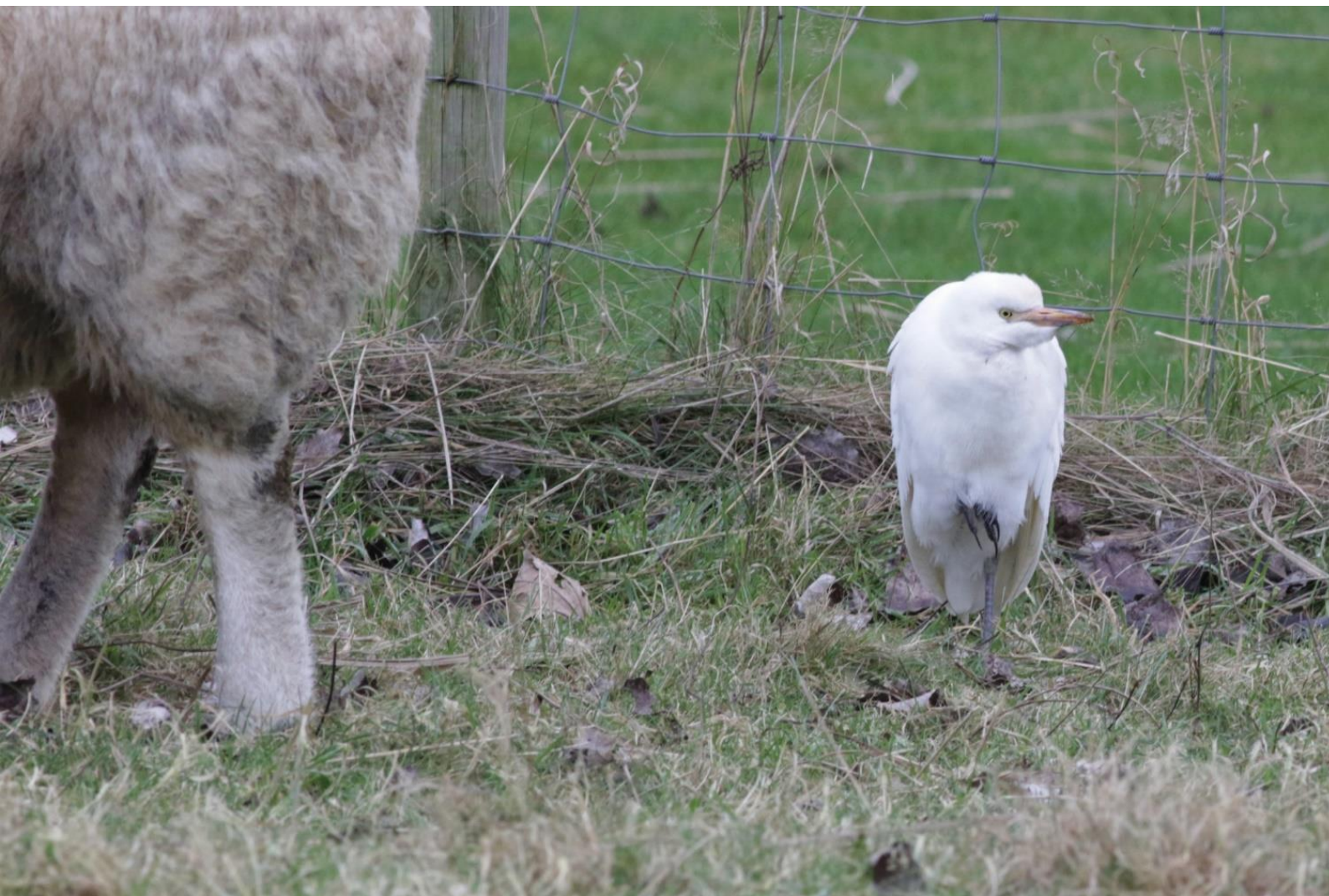
Koereiger – 26 december 2021 Noordwijk - Vinkeveld