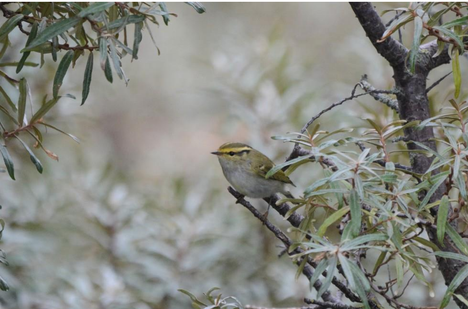
Pallas' Boszanger – 16 oktober 2021 Langevelder Slag