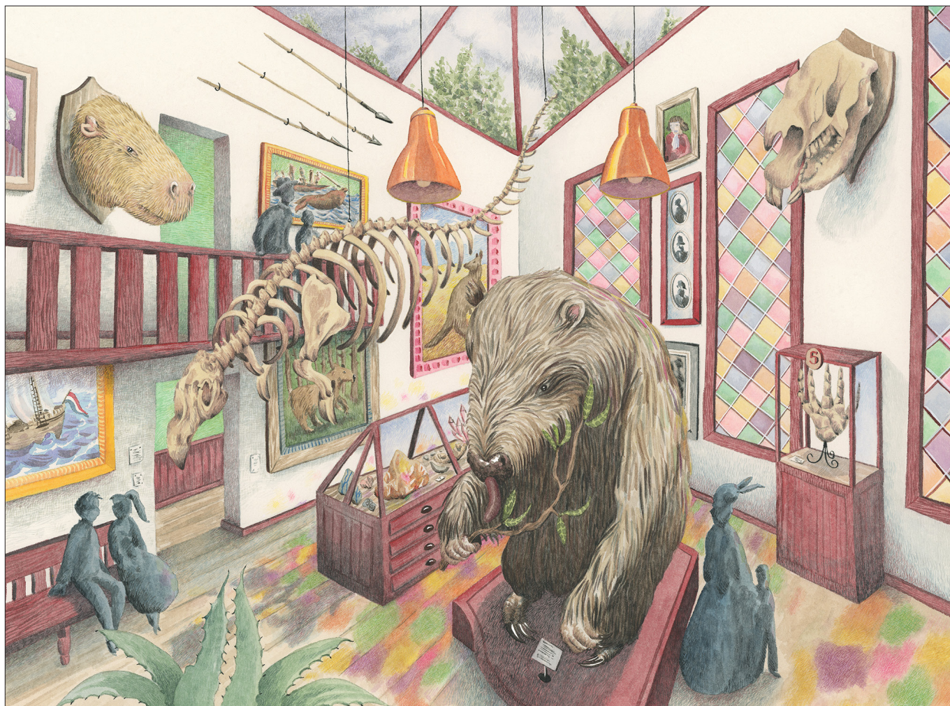
▲ Een metershoge luiaard, een knaagdier zo groot als een stier en een zeezoog die op een omgekeerde boot leek. Je vindt ze alle drie in het Kabinet der Knuffelbeesten. (Marieke Nelissen)

zijn neus een knalgroene nephoorn. Dat is maar goed ook, want sommige mensen hebben veel geld over voor een echte. Die willen ze net als schubdierschubben vermalen tot een Aziatisch medicijn, of ze willen er een beeldje van maken. Daarom worden ook neushoorns in het wild gestroopt. Over de hele wereld staan ze in musea. Maar met een echte hoorn zul je ze daar niet snel vinden, want de kans op een overval is groot. Dat gebeurde in Rotterdam zelfs (Moeliker & Reumer 2011).