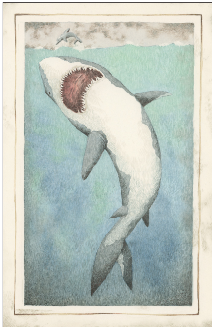
▲ Met zijn rijen vol tanden verslond deze reuzenhaai dolfinjntjes alsof het rozijntjes waren. (Marieke Nelissen)

precies te zijn. Handig, want een beetje Megalodon at alles wat hij tegenkwam. Brak er een keer een tandje af? Geen punt. Achter de voorste rij stonden een heleboel reserve-exemplaren, wachtend op hun beurt om een zeehond in tweeën te happen. Af en toe duiken er trouwens geruchten op dat deze reuzenhaai de oceanen nog steeds onveilig maakt. Maar volgens wetenschappers zijn dat onzinverhalen. Wees gerust, hij is écht uitgestorven.