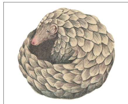
▲ Het schubdier, een opgerold wonderdje met glanzende schubben, staat op de lijst van bedreigde diersoorten. Hopelijk wordt het schubdier nóg beter in verstoppertje. (Marieke Nelissen)

Via een groep knuffelbeesten zo groot als kampeerbussen en een indrukwekkende collectie gevleugelde gevaartes komen we bij de laatste kamer in het boek. En die is nét anders dan de andere. Want op de Parterre van Pechvogels vind je dieren die nog leven. Met de nadruk op het woordje nog . Er staat een clubje van vijf pechvogels die in de penarie zitten. Allemaal staan ze op de officiële Rode Lijst (IUCN) omdat ze dreigen uit te sterven als ónze diersoort niet uitkijkt. Wat dacht je van deze twee?