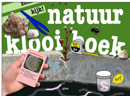
▲ Het thuisnatuurklooiboek is aantrekkelijk geprijsd. (Uitgeverij Pica)