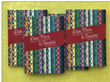
▲ Bezoekers krijgen het boekje 'Dier, Mens & Traditie' gratis mee naar huis.