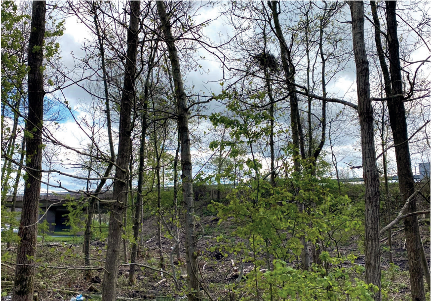
Foto 1. Bezet sperwernest in sterk uitgedund nestbos bij Marum, 7 mei 2021. Occupied Sparrowhawk nest in recently thinned deciduous stand, Marum, 7 May 2021.

In 2021 lag het broedsucces van de honderd gevolgte nesten op een miserabele 57%. Dit was iets slechter dan in 2018 en 2020 (61 en 63% respectievelijk), maar beter dan in 2019 (49%). Dit is frappant: de laatste vier jaar ligt de verhouding succesvolle nesten maar iets boven de helft! Uitval kwam voor gedurende nestbouw of in de prille broedfase (9%), in de eifase (51%), en in de jongenfase (40%), waar predatie de hoofdoorzaak van het mislukken is.