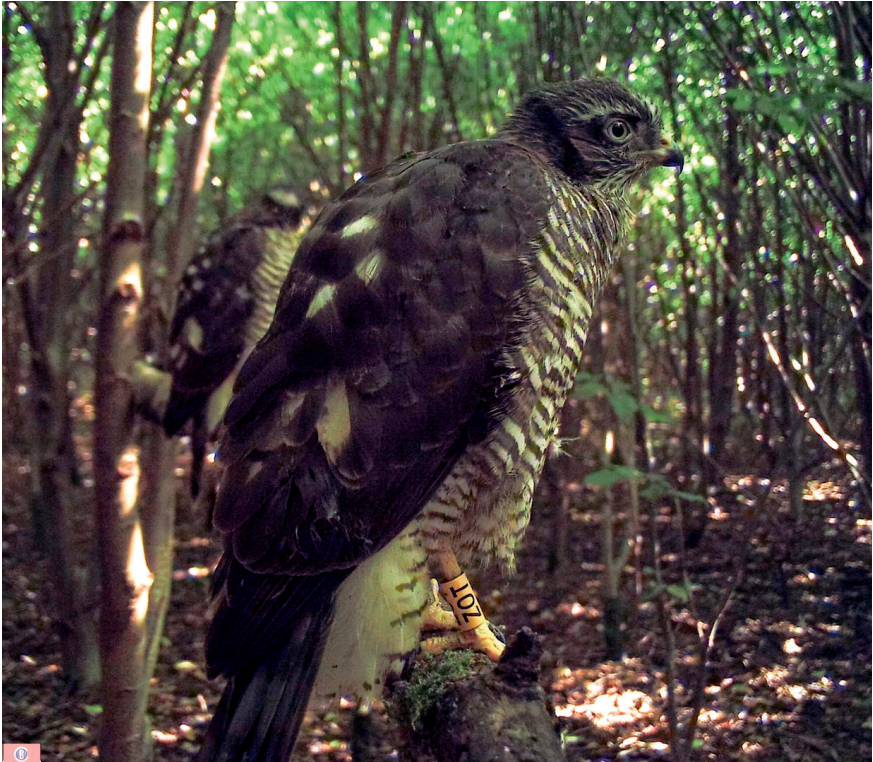
Foto 2. Pas uitgevlogen jongen op de zitstok. Tynaarlo, 22 juli 2021. Fledgling Sparrowhawks on an artificial sitting post near the nest, Tynaarlo, 22 July 2021.

seizoen geplaatste cameraval, kwamen alleen pas uitgevlogen jongen op de plaat (Foto 2). Het mooie is dat in alle gevallen waar adulte sperwers geregistreerd zijn, ook hun leeftijd (2kj of >2kj) kon worden vastgesteld en of ze geringd waren of niet.