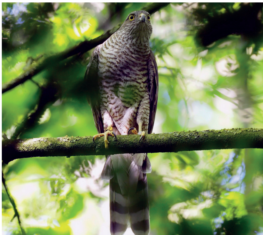
Foto 3. Sperwer, 2de kalenderjaar vrouw met kleurring in de buurt van haar nest, geringsd als jong in Zuidhorn in 2020. Bedum, 10 juni 2021. Second calendar-year female Sparrowhawk near its nest, identified by its coded colour-ring; she had been ringed as nestling in 2020, 3 km from its present nest sit at Bedum; 10 June 2021.