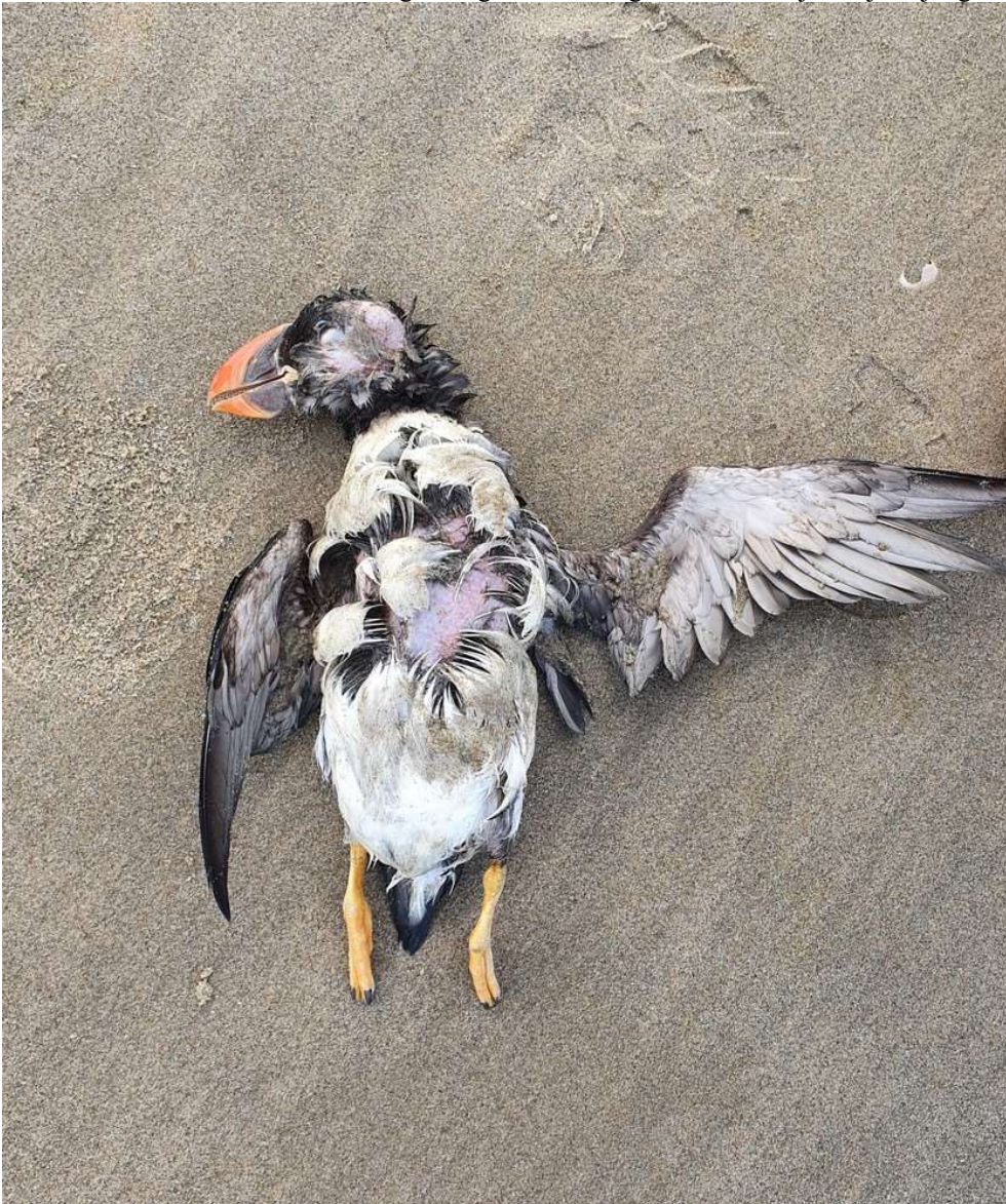
Papegaaiduiker - Fratercula arctica (adult winterkleed) 2 februari 2022 Noordwijk - Coepelduynen - strand

In het najaar van 2021 was er een opvallende sterfte onder Zeekoeten en Alken in de centrale Noordzee. Er spoelden veel verzwakte en dode vogels aan op de Schotse, Engelse en Nederlandse kust. De oorzaak is nog steeds onduidelijk. Was het een slechte voedselsituatie, giftige algenbloei of een combinatie? Ook Papegaaiduikers werden getroffen. Op de Nederlandse stranden spoelden tenminste 200 dode vogels aan. Ook in het Noordwijkse waarnemingsgebied gebeurde dat. Op 2 februari vond Gijsbert Twigt een dode Papegaaiduiker op het strand van de Coepelduynen. De vogel was volwassen, wat goed te zien was aan de grote oranje snavel. Dit gold voor vrijwel alle vondsten aan de Nederlandse kust deze winter. Dit maakt de sterfte van deze fraaie vogels nog raadselachtiger. Normaal zijn het juist jonge vogels die de moeilijke eerste