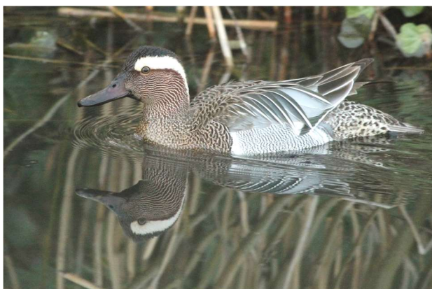
Zomertaling – 24 maart 2022 Katwijk aan Zee - Zwarte Pad

De maand maart was droog en haalde een record wat betreft zonuren. Een groot deel van de maand zat de wind in het zuidoosten. De temperaturen liepen regelmatig al flink op, met name rond de 22°. Vanaf 25 maart draaide de wind naar het noorden. De maand eindigde met een plotselinge koude periode die in april zou doorzetten, inclusief late sneeuw. Van een vroeg voorjaar belandden we hiermee uiteindelijk in een koud voorjaar.