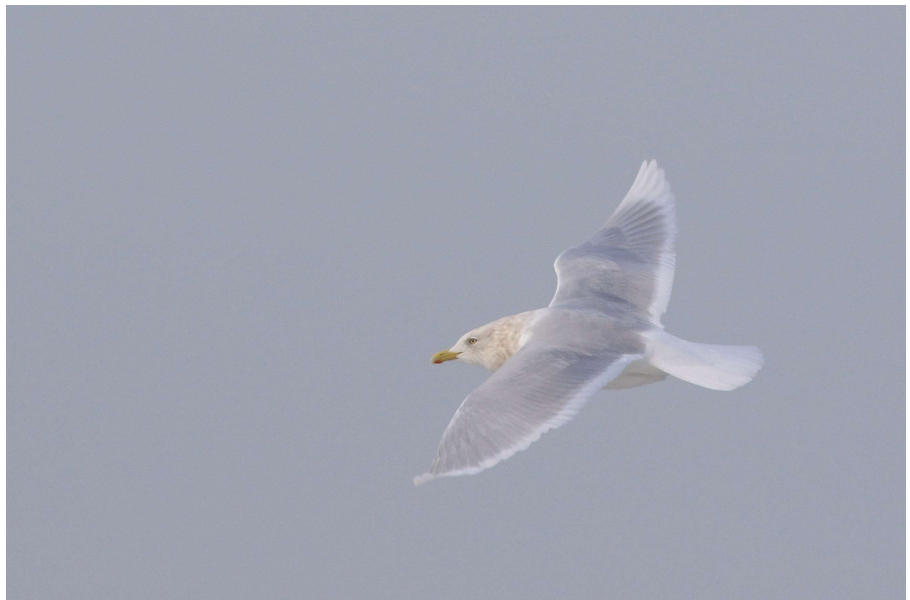
Kleine Burgemeester - (adult winterkleed) 2 februari 2022 Noordwijk - Noordduinen - strand

Stern passeerde op 19 februari (PS JD). Op 28 februari trokken 2 Zomertalingen langs, de vroegste ooit voor de telpost en ons waarnemingsgebied (JD). De eerste Veldleeuwerik zong op 5 februari in de Noordzijderpolder (SP). Het paar Ooievaars in de Bronsgeest bleef de hele winter aanwezig en bezocht vooral Polder Hoogeweg. Op 15 februari waren ze aan het bouwen aan het nest (BS). In de Noordduinen zat op 23 februari een Kruisbek (CZ). Op 27 februari waren er 2 Tureluurs aanwezig in De Klei (JVr). Vanaf de 25 e was hier ook een paar Tafeleenden aanwezig, op de broedlocatie van vorig jaar (BS). Op 13 februari vloog een Smelleken over Polder Hoogeweg (JD). Op 27 februari zat de eerste Rouwkwikstaart in de Coepelduynen (JHa).