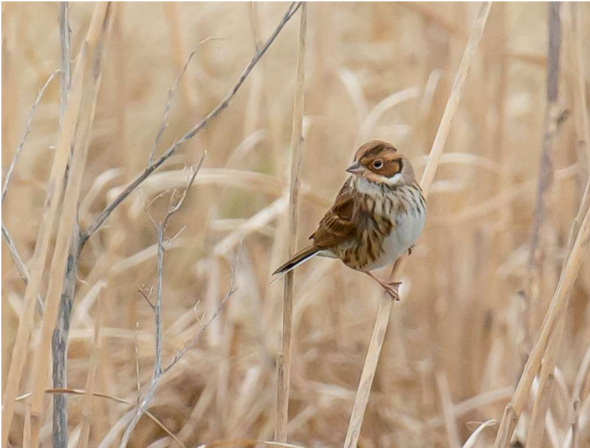
Dwerggors - 19 februari 2022 Noordwijk - Vinkeveld

De Dwerggors bleef t/m 25 februari aanwezig in het Vinkeveld (BS ea). Hier zaten ook 30 Rietgorzen op 12 februari (WBo). In de Noordduinen rond de Duindamse Slag vlogen tot 23 februari 2 Geelgorzen rond (CZ EM). Op 1 februari zat er een Siberische Tjiftjaf bij het Wantveld Katwijk (GT). De grote groepen meeuwen bleven aanwezig tot het midden van de maand, met zo'n 4000 Zilvermeeuwen op het strand van de Coepelduynen op 13 februari (AM). Op het strand van de Coepelduynen en van de Noordduinen waren minimaal twee verschillende Kleine Burgemeesters aanwezig, een tweede en