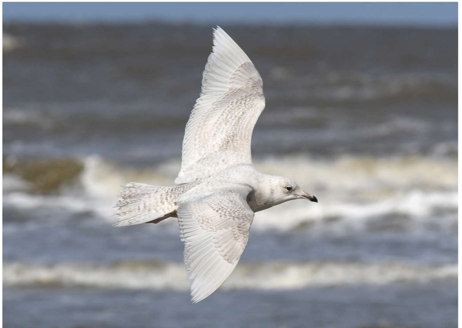
Kleine Burgemeester - (tweede kalenderjaar) 1 april 2022 Noordwijk - Noordduinen - strand