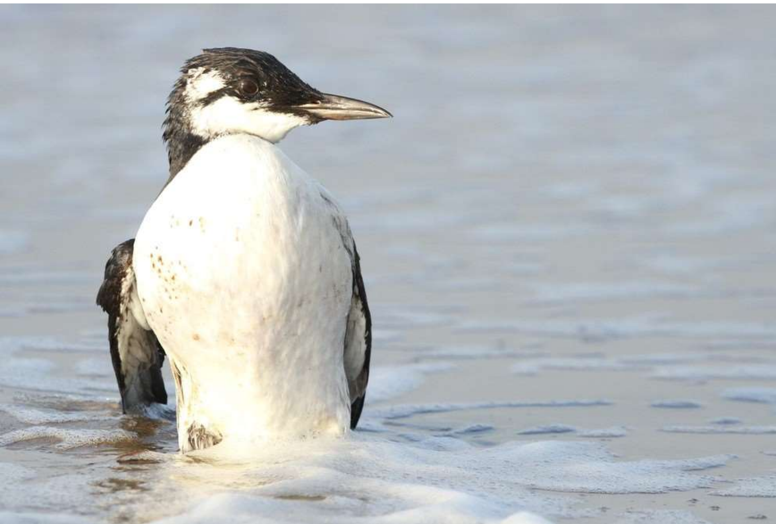
Zeekoete – met olie 21 februari 2022 Katwijk aan Zee - strand

later waren er van Wassenaar tot Zandvoort veel berichten over aangespoelde bolletjes olie. Of het vrachtschip hier de oorzaak van was, bleef onduidelijk, maar wel zagen we een beeld dat we lang niet meer hadden gezien. Een deel van de Zeekoeten die aanspoelden, had ook olie op de veren. De aantallen stonden in geen verhouding tot die uit het verleden toen er geen winter zonder olie voorbij ging. Maar het was deze winter wel een stapeling van problemen voor de Zeekoeten en Alken.