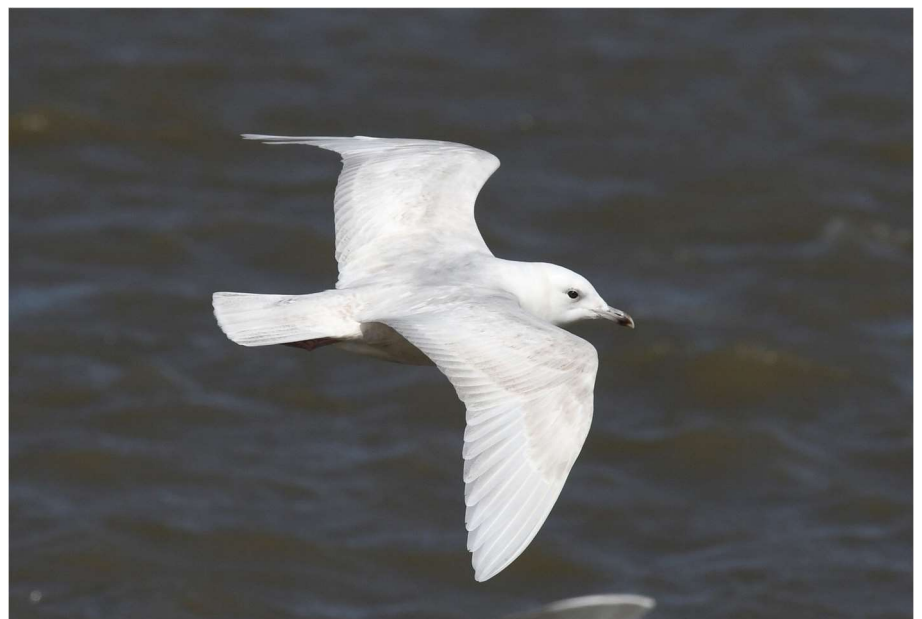
Kleine Burgemeester - (derde kalenderjaar) 1 april 2022 Noordwijk - Noordduinen - strand