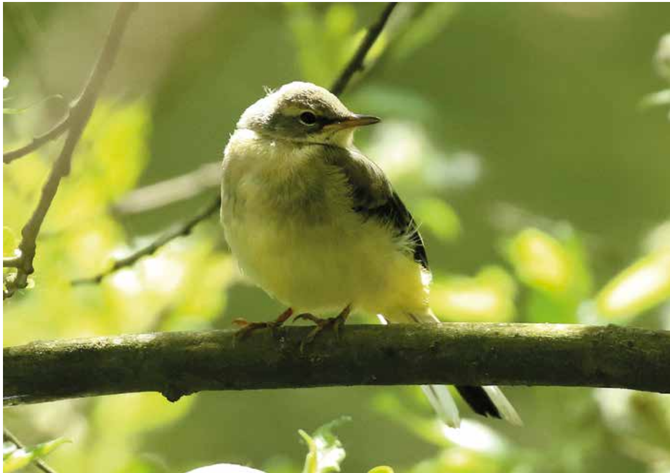
● Juvéniele grote gele kwikstaart, 5 mei 2020.

terzuivering) Hilversum gebruikt kan hebben als broedplek. In het verleden zat ook bij de oude RWZI, bij het stromende water, af en toe een grote gele kwikstaart; maar wel buiten de broedtijd. Datzelfde zien we nog steeds bij de RWZI's van Huizen en Blaricum.