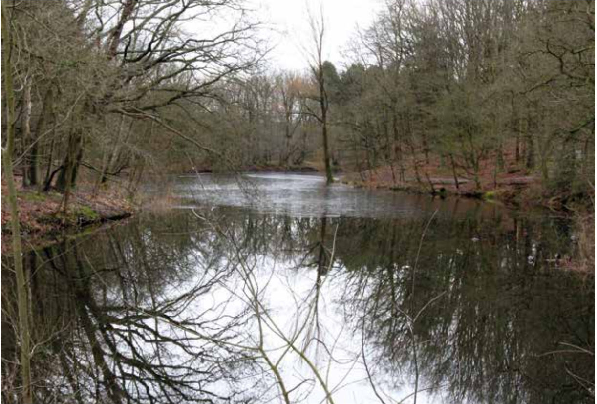
● Anna's Hoeve: de grote gele kwikstaarten foerageerden langs de oevers en op de hellingen.