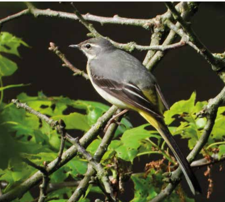
● Vrouwelijke grote gele kwikstaart, 2 mei 2020.

te nemen is dat dit één van de twee adulte vogels was die regelmatig in Anna's Hoeve foerageerde. De conclusie is dat de grote gele kwikstaarten een tweede broedsel hebben gehad. Door de route van de voedselvluchten richting Hilversum en een waarneming bij de poel in Monnikenberg is het mogelijk dat de broedplek zich bevond in de nieuwbouw van ziekenhuis Hilversum of de naastgelegen in aanbouw zijnde appartementen (zie kaart). Maar een andere locatie is niet uit te sluiten.