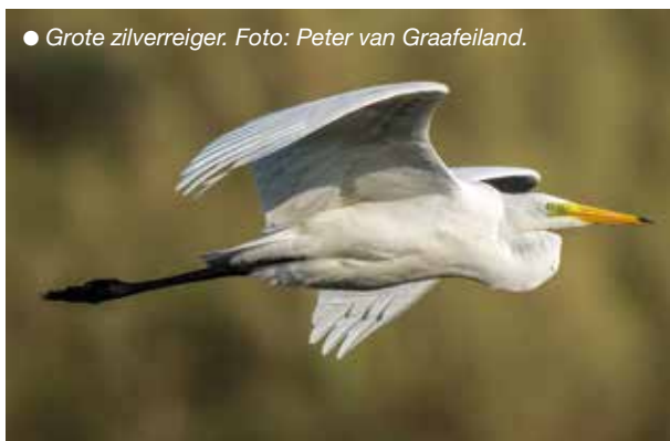
● Grote zilverreiger.

Een enkele keer komt er geen vogel op de slaappleats. Soms met een duidelijke oorzaak: vorst en ijs. Ook bij extreem hoog water reageren de vogels direct: ze komen niets vermoedend aanvliegen, om bij het dalen te twijfelen en laag door te vliegen naar een mij onbekende zuidwestelijker