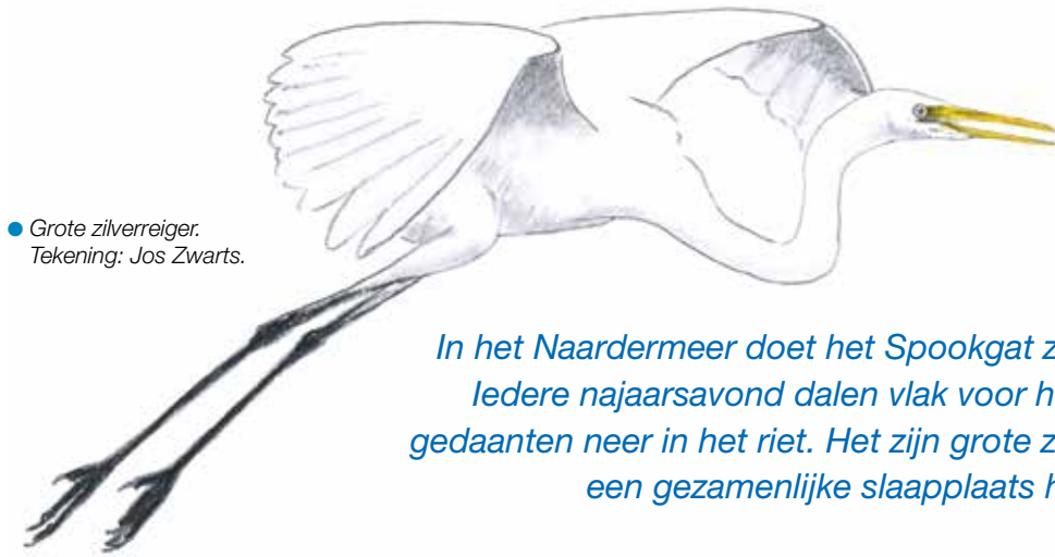
● Grote zilverreiger. Tekening: Jos Zwarts.

In het Naardermeer doet het Spookgat zijn naam eer aan. Iedere najaarsavond dalen vlak voor het donker witte gedaanten neer in het riet. Het zijn grote zilverreigers die hier een gezamenlijke slaappleats hebben.