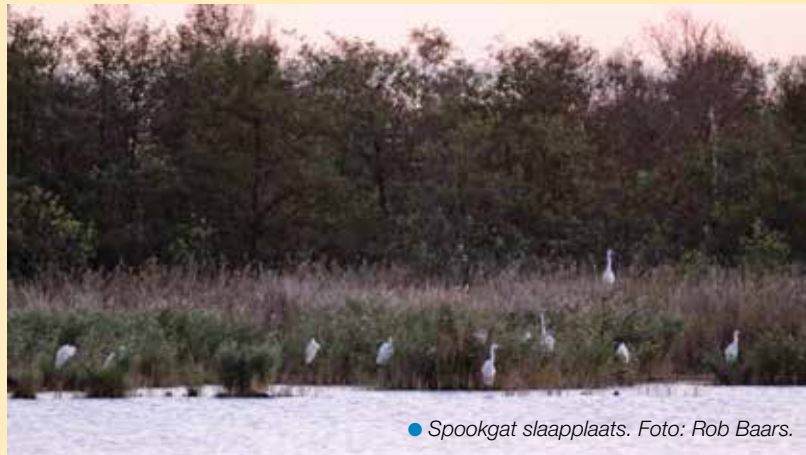
● Spookgat slaappleaats.