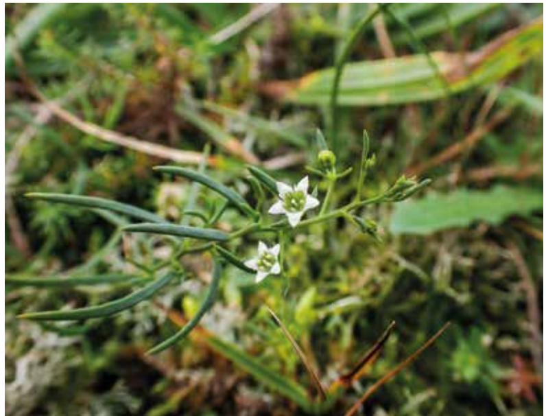
● Liggend bergvlas.