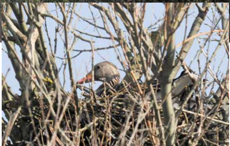
● Grauwe gans op boomnest op 8m hoogte in een wilg (8-4-2022).

( Ulmus sp.): van ei, rups, pop tot vlinder. De rups is aanvankelijk licht gekleurd, maar wordt donkerder licht wanneer hij gaat verpoppen. De soort leeft bij grote vruchtdragende iepen. Nieuw onderzoek heeft echter duidelijk gemaakt dat de soort hoogstwaarschijnlijk al die tijd over het hoofd gezien is. In Zuid-Limburg komt hij voor op tientallen plekken en ook daarbuiten is hij gevonden, in de Achterhoek, Noord-Brabant (vooral veel in Eindhoven) en ook in Amsterdam. De gemeente Amsterdam doet in samenwerking met de Vlinderstichting jaarlijks onderzoek naar de verspreiding van de iepenpage. Naast de waarneming in de Damstraat zijn ook dit jaar weer exemplaren gezien op 17 juni boven de iepenbeplanting langs de Henk Sneevlietweg en op 20 juni op begraafplaats Vredenhof. Het is niet ondenkbaar dat er in Amsterdam binnenkort nog veel meer nieuwe locaties worden gevonden. De stad is immers zeer rijk aan iepen. Wordt vervolgd!