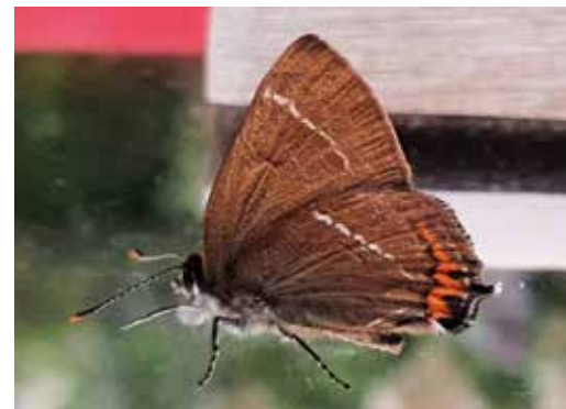
● Amsterdamse iepenpage.

Timmermans, 2017) en in 2021 op begraafplaats Vredenhof, maar zo duidelijk als in de Damstraat nog nooit. De waarnemingen uit 2016 en 2021 betroffen vliegende exemplaren boven de kronen van de iep en mooi en duidelijk beeldmateriaal ontbrak. Tot voor kort leek dit voor Nederland een uiterst zeldzame standvlinder. De vlinder vliegt in één generatie tussen midden juni en half augustus, heeft een zeer verborgen leefwijze en wordt daardoor makkelijk over het hoofd gezien. De gehele levenscyclus van de iepenpage speelt zich af in de iep