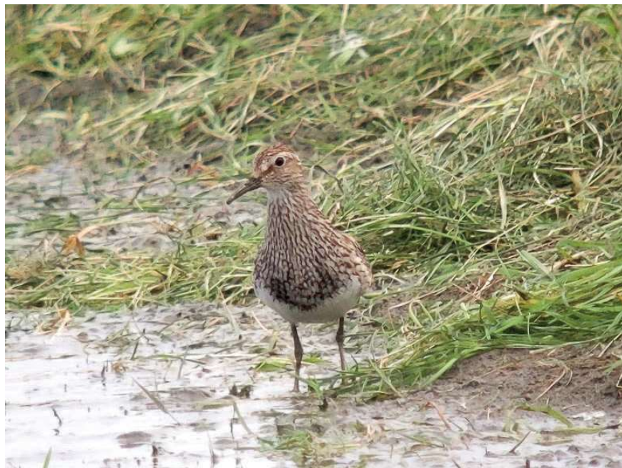
Gestreepte Strandloper, 13 augustus 2021, Marken

de Bries). Op 2/8 vliegt er 1 naar zuid over de Vijfhoek (GvD). Op 7 en 8/9 foerageren er 6 in De Nes in Waterland (WP, EdB), op 12/9 is er nog 1 aanwezig (LIJ). Krombekstrandloper verschijnt alleen op Marken: 1 vogel op 13/6 (Alfred de Weerd) en 2 op 20/7 (LIJ). Op 8/5 een Temmincks Strandloper op Marken en later op het Landje van Geijssel (WP, EH, PvdW). Op 4/8 wordt een Gestreepte Strandloper ontdekt op Marken (WP). De vogel blijft twee weken plakken en is voor het laatst gezien op de avond van 16/8 (RB). Hoogste aantal Bonte Strandlopers is 11 op Marken op 3/9 (WP).