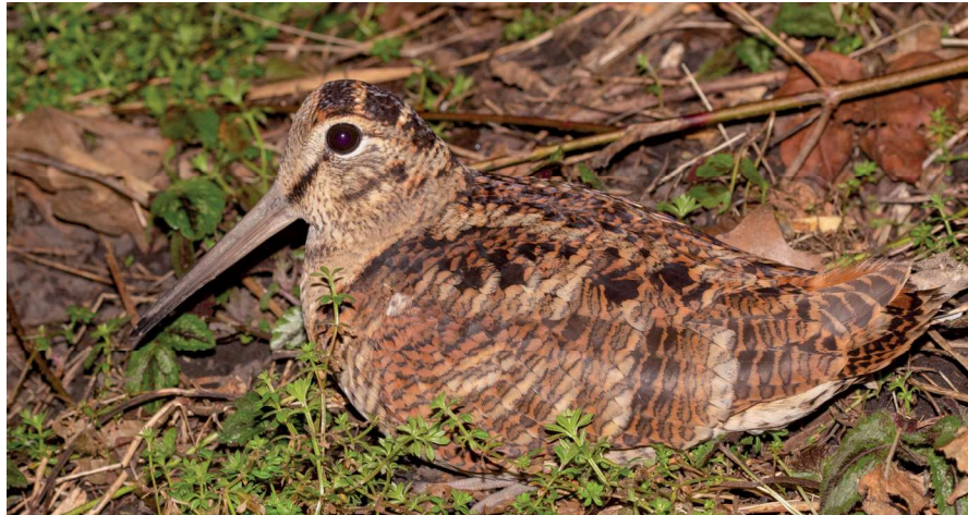
'In de Noordduinen waren minstens twee broedterritoria Hootsnip'