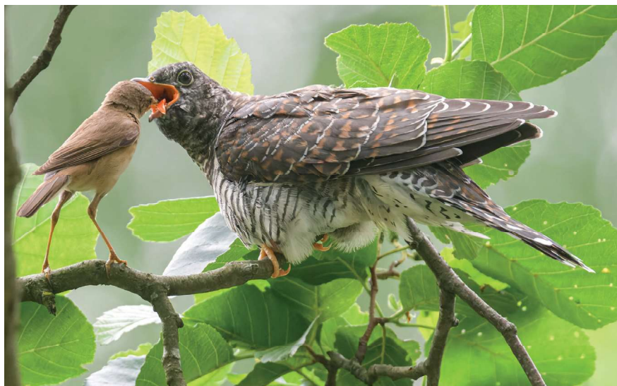
Koekoeksjong dat gevoerd wordt door een Kleine Karekiet