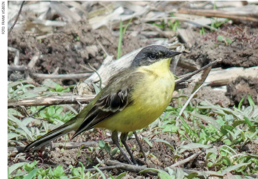
Noordse Kwikstaart, 12 mei 2021, Waterland - Aandammergouw