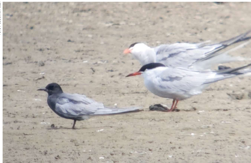
Zwarte Stern, 12 juni 2021, Marken