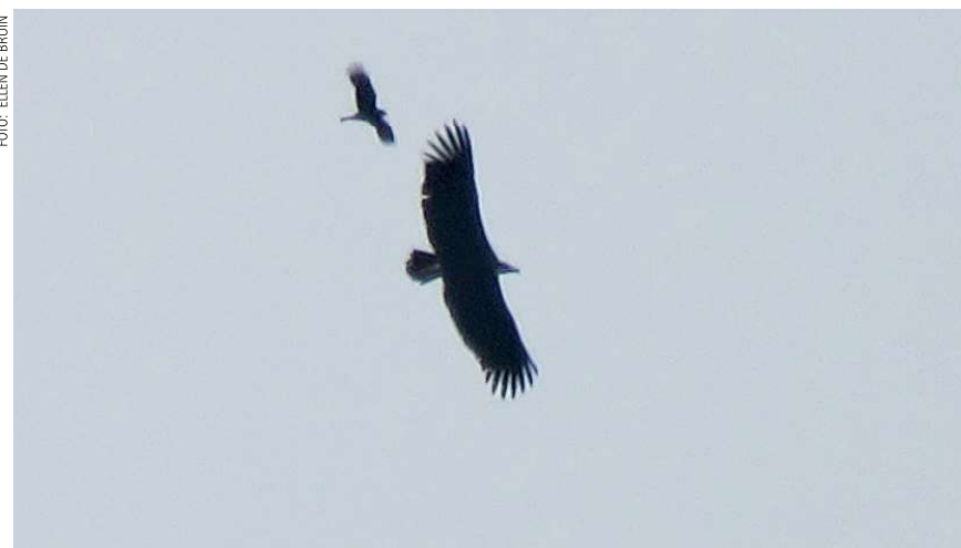
De Monniksgier is de grootste roofvogel van Europa. Achter de Monniksgier vliegt een Buizerd