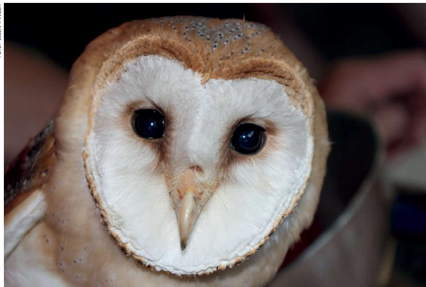
Kerkuil, 22 juli 2019, Assendelft