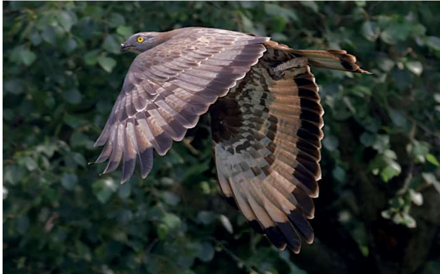
Wespendief met een deel van de honingraat in de klauwen, 7 juli 2021, Amsterdamse Bos