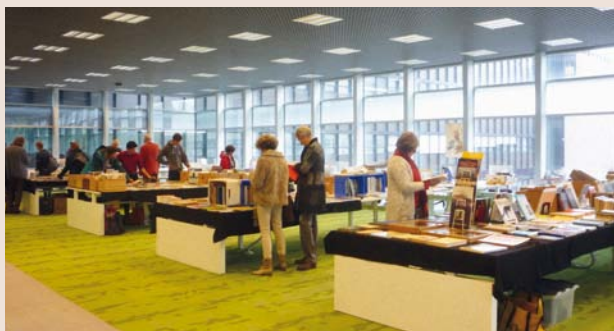
De boekenmarkt tijdens de Landelijke Contactdag in het nieuwe Koningsbergergebouw in de Uithof.