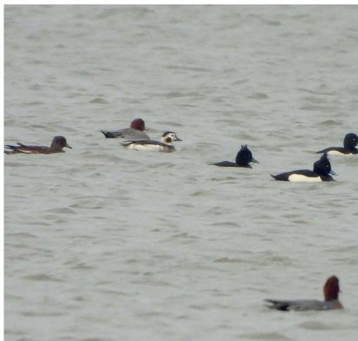
Vrouwtje IJseend op de Gouzee, 1 januari 2022