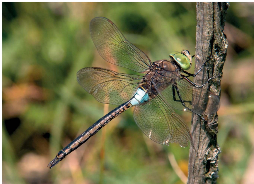
De Zuidelijke Keizerlibel komt steeds noordelijker voor