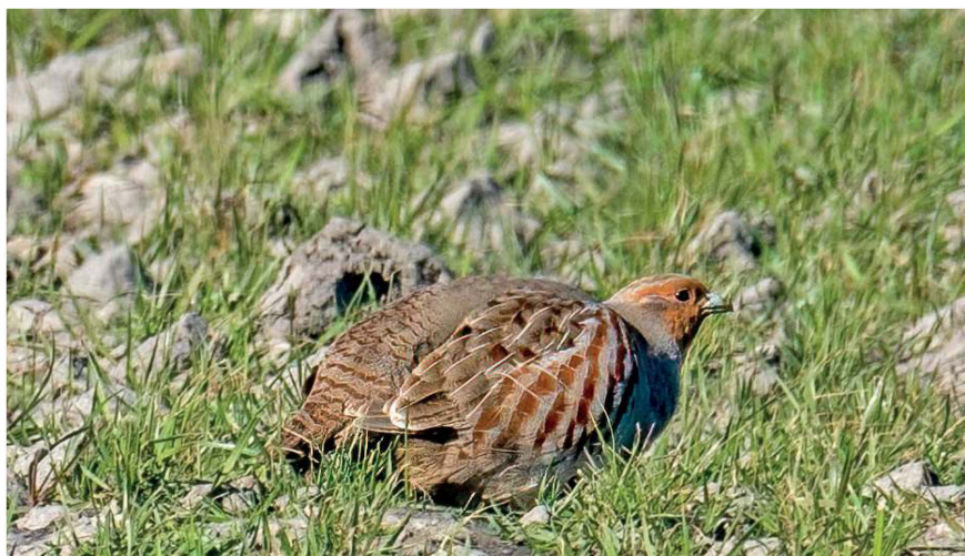
Patrijs, 28 februari 2022, Schiphol

roepende Regenwulp gemeld in De Broekermeer, Waterland (René Vos). Het is de enige waarneming dit kwartaal.