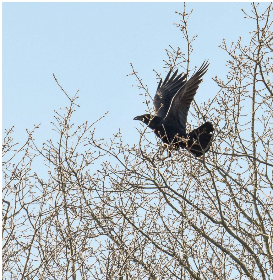
Raaf in een populier, 23 maart 2022, De Heuvel, Amsterdamse Bos.