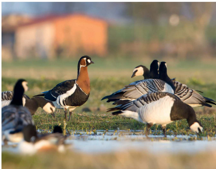
De Roodhalsgans op Marken