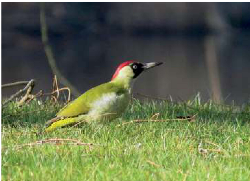
Groene Specht, 10 maart 2022, Westgaarde

over de Aetsveldsche Polder, in oostelijke richting (EdB, RivD).