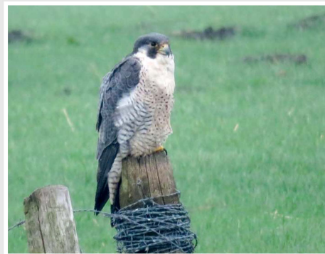
Altijd de paaltjes checken! Hier een Slechtvalk