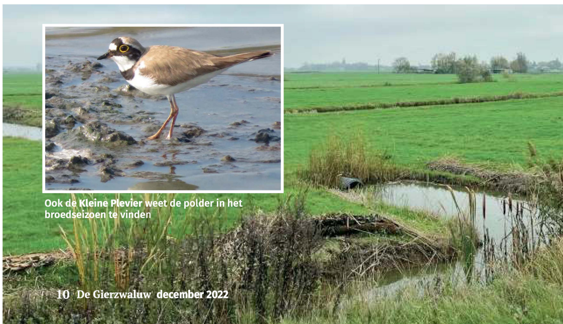
Ook de Kleine Plevier weet de polder in het broedseizoen te vinden