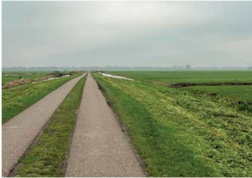
De kaarsrechte Middenweg gaat dwars door de polder

broedseizoen en houden de waterstand hoog. Dat vinden Grutto's en Kieviten fantastisch." Aan de sloten zie je de invloed van de boer. Aan de zuidwestkant staat het water veelal laag, hier en daar zie je het land zelfs afbrokkelen, zo de sloot in. Aan de andere kant van de weg kiezen boeren vaker voor een hoge waterstand. Tureluurs en ook eenden zoals Smienten vinden de lage oevers prettig. Een groep Smienten vliegt fluitend op, de mannetjes met de karakteristieke witte spiegel. Verderop in de velden grazen grote groepen