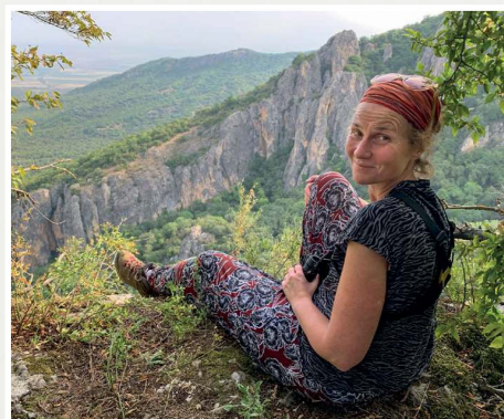
Chachuna National Park, Georgië