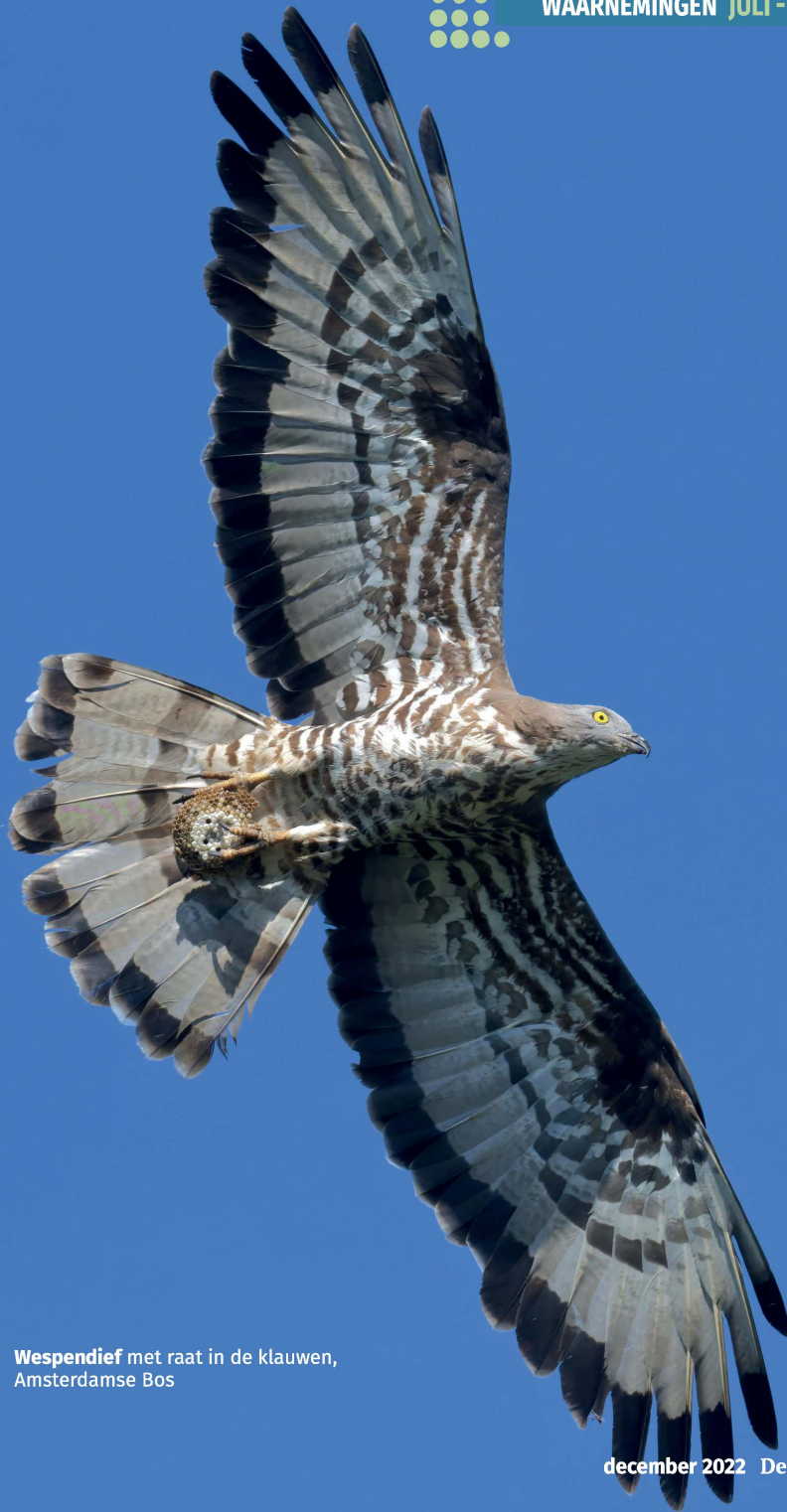
Wespendief met raat in de klauwen, Amsterdamse Bos