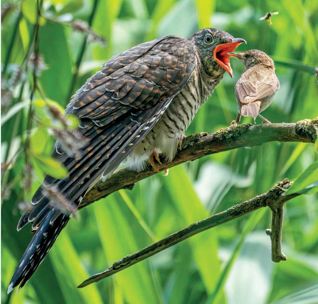
Koekoek gevoerd door Kleine Karekiet

van Vlaanderen. Trekt op met groepje Spreeuwen, maar gedraagt zich redelijk solitair” (Jan Keizer). Die dag wordt de vogel bewonderd door 24 andere vogelaars. Hij is vaak te vinden in één van de vijgenbomen die er staan, een dag later niet meer. Op de middag van 22/9 wordt de vogel toch weer gezien (LH, RR).