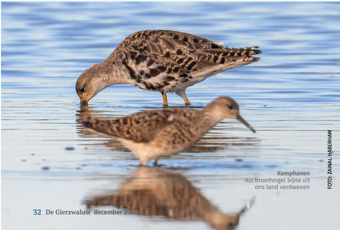
Kemphanen Als broedvogel bijna uit ons land verdwenen

Kleine Plevieren worden gemeld in de Bovenkerkerpolder op 8/7 (AJ) en in Polder IJdoorn op 7 en 9/8 (1e wrn. André van Vliet). Op 20/8 vliegen 12 Morinelplevieren