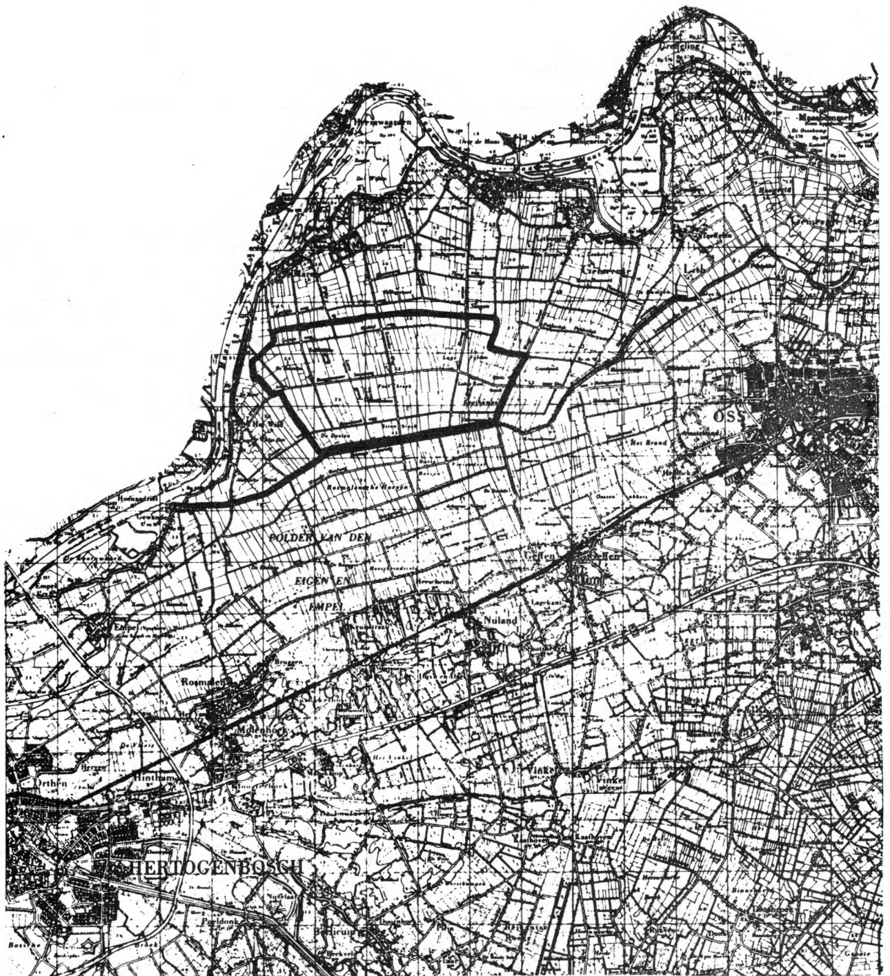
Figuur 1. Ligging van het telgebied. Schaal 1 : 100.000.