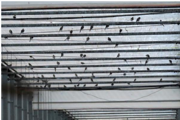
Wachten in de nok, 16 september 2021 (SV)

Als het personeel van de kwekerij in de ochtend om 7:00 uur aanvangt met werken, verplaatsen de vogels zich naar de nok van de kas. Daar wachten ze het moment af dat de ramen weer open gaan. Afhankelijk van de binnentemperatuur gaan de ramen namelijk automatisch open en dicht, ook sluiten doeken het glazen dak af ter isolatie.