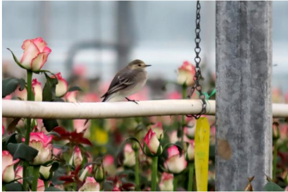
In de rozenkas, 21 september 2021 (SV)

Als het personeel van de kwekerij in de ochtend om 7:00 uur aanvangt met werken, verplaatsen de vogels zich naar de nok van de kas. Daar wachten ze het moment af dat de ramen weer open gaan. Afhankelijk van de binnentemperatuur gaan de ramen namelijk automatisch open en dicht, ook sluiten doeken het glazen dak af ter isolatie.