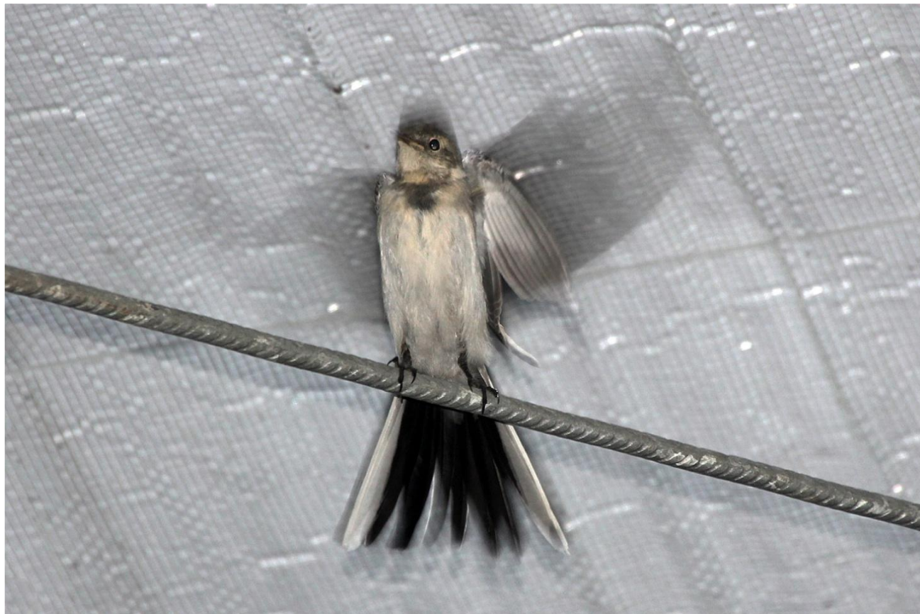
Op de slaapplaats, 16 september 2021 (MS)

In een artikel uit 2001 wordt behalve het overnachten van Witte Kwikstaarten in kassen ook de 'plaatstrouw' besproken. Het ringonderzoek werd o.a. gedaan door Jan Wouters in Reusel en Middelbeers. Uit onderzoek blijkt dat volwassen vogels plaatstrouwer zijn dan jonge vogels. En dat er meer mannen dan vrouwen in de broedtijd werden gevangen omdat vrouwen