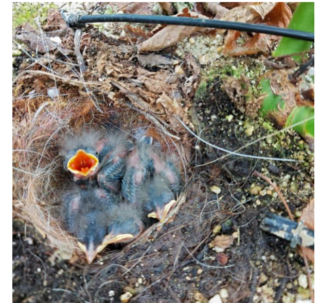
Nest met jonge kwikken in een pot, zomer 2021

een stabiele populatie van 70.000-100.000 broedparen. In de winter zijn er maar 2000-8000 vogels (Website Sovon).