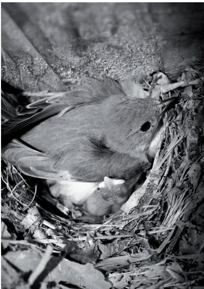
Bonte vliegenvanger

Dus als je eens mee wilt, let dan op de aankondigingen en kom meehelpen. ■