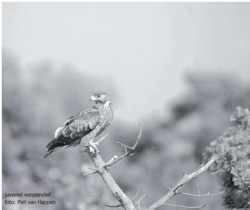
juveniel wespddief

Ook in 2008 is er vooral gepost op dagen met redelijk mooi weer zonder neerslag en/of harde wind. De waarnemingen zijn steeds nauwkeurig ingetekend op topografische kaarten (1:50.000) met de vermelding: waar komt de vogel vandaan, waar vliegt hij naar toe en is hij wel of niet prooidragend. Later werden thuis alle waarnemingen gecontroleerd