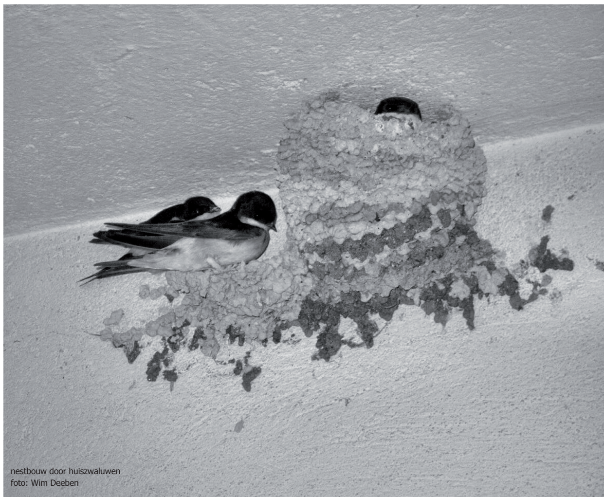
nestbouw door huishwaluwen