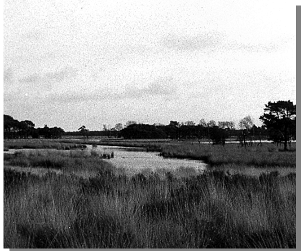
Aantal getelde klapseksters tijdens simultaantellingen op de Strabrechtse heide