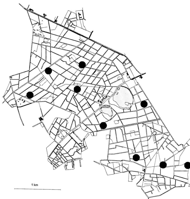
Figuur 2. Het aantal waargenomen paren.