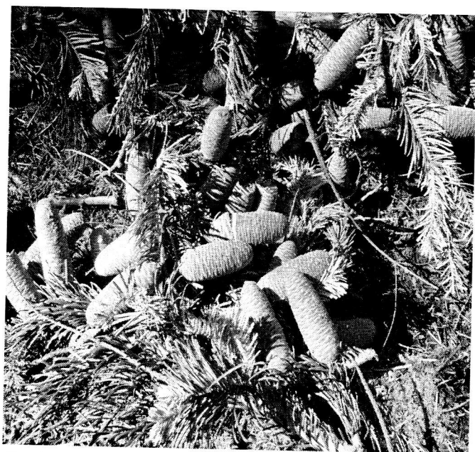
Kegels van de Reuzenzilverpar