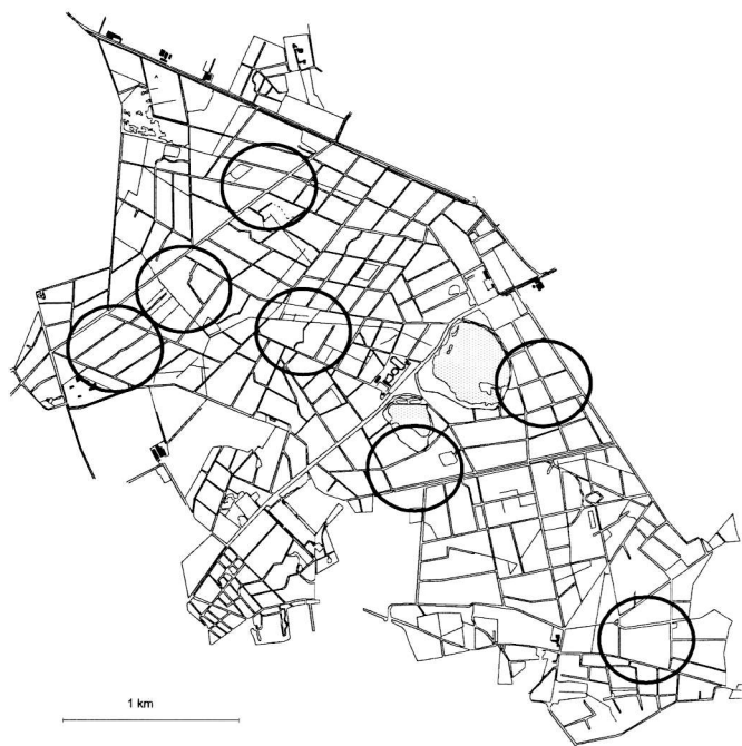
Figuur 3. Het aantal territoria.