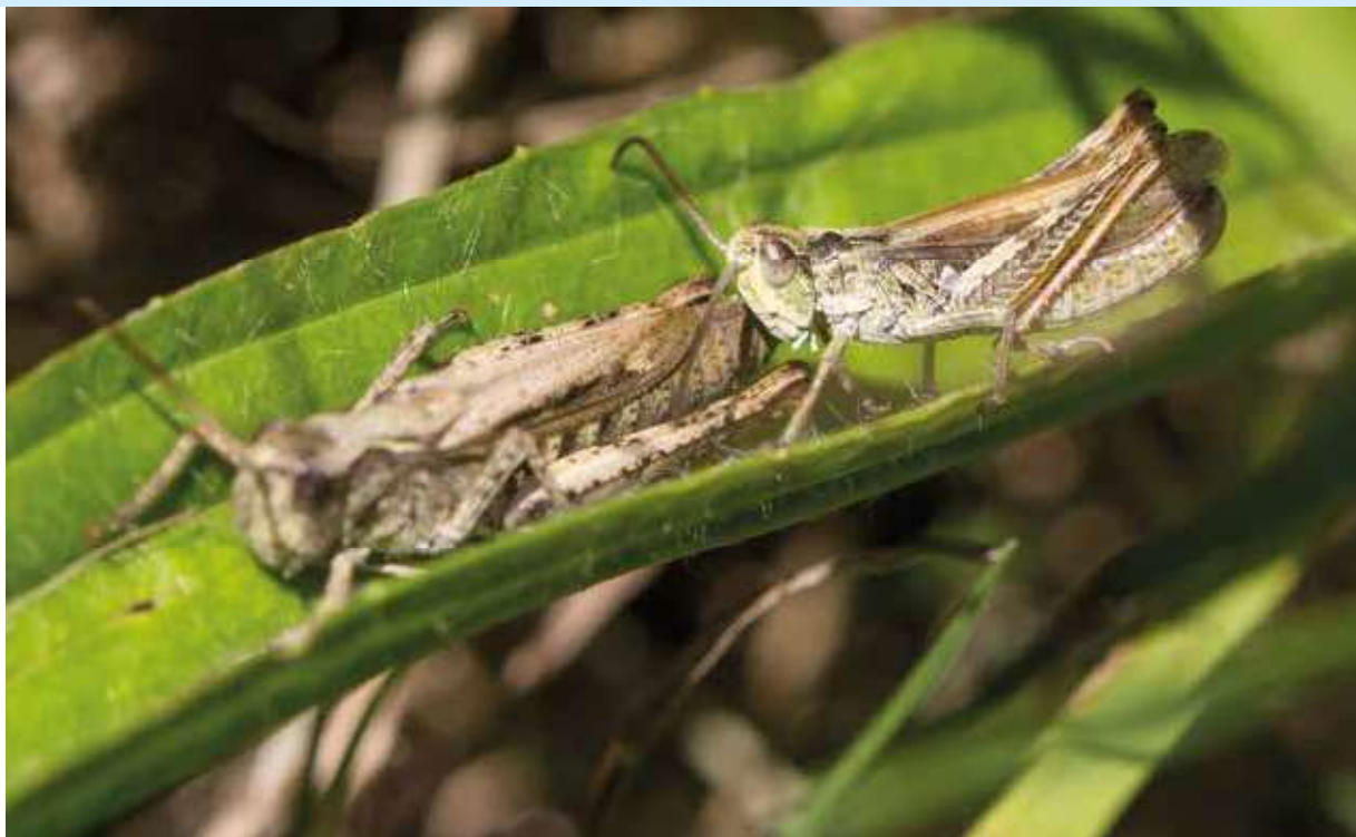
● Een vrouwtje (links) en mannetje locomotiefje.

spoor (1992), dus daarop werd extra focus gelegd tijdens de inventarisatie. Hier blijkt de soort helaas te zijn verdwenen (Drukker, 2022).