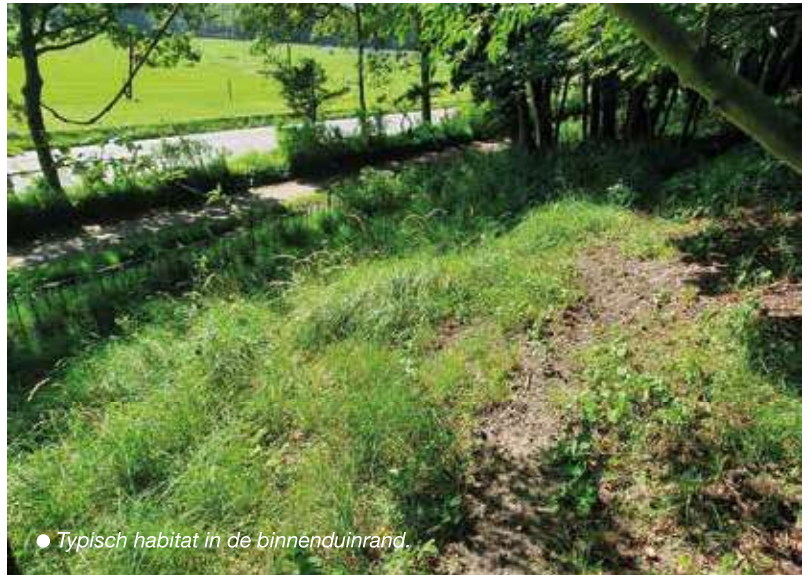
● Typisch habitat in de binnenduintrand.

Het locomotiefje is een van de meest zeldzame sprinkhaansoorten van Nederland. Er zijn slechts twee populaties in ons land bekend. Eén daarvan bevindt zich in de binnenduintrand van Santpoort.