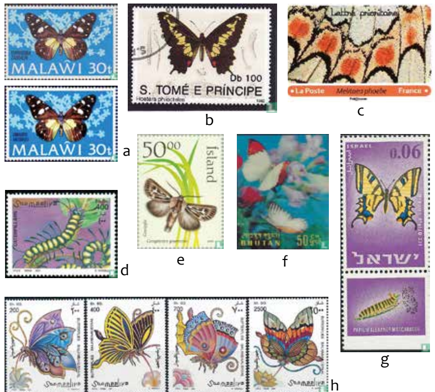
Verschillende uitgaven. a. Amauris ansorgei , met foutieve naam en heruitgave met correcte naam (Malawi 1973), b. Euryades duponcheli , met de niet-bestaande naam Hoetera philocteles (Sao Tomé en Príncipe 1992), c. fragment van knoopkruidparelmoervlinder (Frankrijk 2020), d. rups van elzenuil Acrionicta alni (Somalië 2001), e. bonte grasuil Cerapteryx graminis (IJsland 2000) f. driedimensionale zegel (Bhutan, 1968), g. imago en rups op tabzegel van Papilio alexanor (Israël 1965), h. serie fantasievlinders (Somalië 1997).