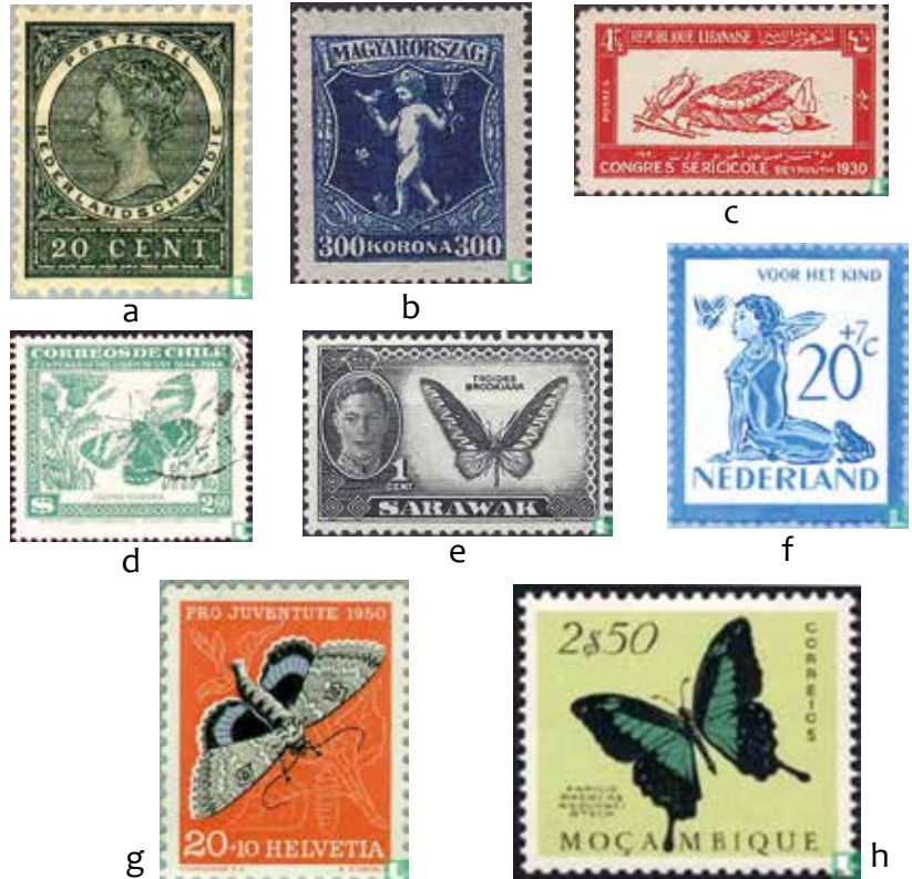
Oude zegels met vlinders. a. wingerdijlstaarten in de randversiering bij koningin Wilhelmina (Nederlands-Indië 1903), b. tuberculosezegel met klein vlindertje (Hongarije 1924), c. zijderupscongres in Beirut (Libanon 1930), d. Castnia eudemia (Chili 1948), e. Trogonoptera brookiana (Maleisië Sarawak 1950), f. meisje met kikker en vlinder (Nederland 1950), g. blauw weeskind (Zwitserland 1950), h. Papilio phorcas (Mozambique 1953).

Natuurlijk worden vlinders veelvuldig afgebeeld op zegels die aandacht vragen voor natuur- en milieubescherming. Maar het blijkt dat vlinders wereldwijd voor veel meer symbool staan. Ze staan op zegels voor geboortepanning, bestrijding van geweld tegen vrouwen, liefde, Rode Kruis, onafhankelijkheid, tuberculose, vrede, voorjaar/april/mei, zomer, lucht- en ruimtevaart, mensenrechten, tafeltennis, ecotoerisme, bestrijding van diverse ziekten, orgaan-donatie, wandelwegen, drugsmisbruik en klimaatverandering. Enkele landen hebben een nationale vlinder, die natuurlijk veelvuldig op zegels te vinden is. Mexico heeft de monarchvlinder en Jamaica de reuzenpage – Papilio homerus . Op de vlag van de deelstaat Oro van Papoea-Nieuw-Guinea staat de Alexandra's vogelvlinder Ornithoptera alexandrae – de