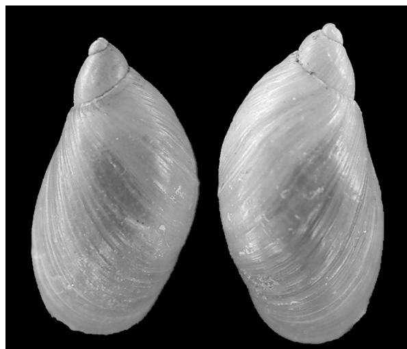
Succinea putris rechts- en linksgewonden