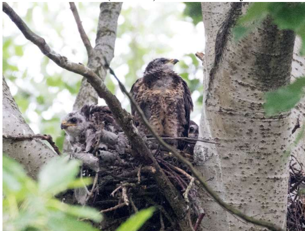
Buizerdnest met 3 jongen

Halverwege onze ronde bevindt zich het “Spreeuwenbos”, waar een kolonie broedt van ca. 40 paar Spreeuwen. Altijd boeiend om te horen (imitaties) en te zien. Pas tijdens ons