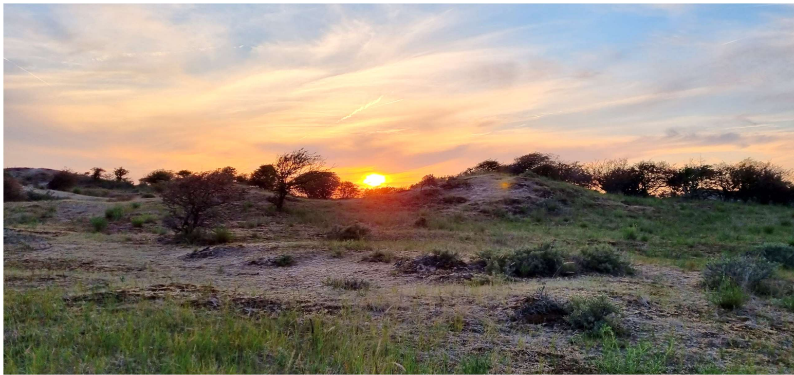
Avondzon in juni in het Wolfsveld