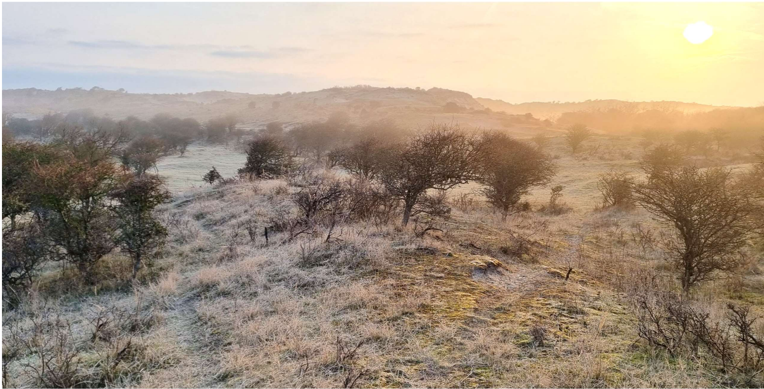
Ochtendglorien in maart in het Wolfsveld