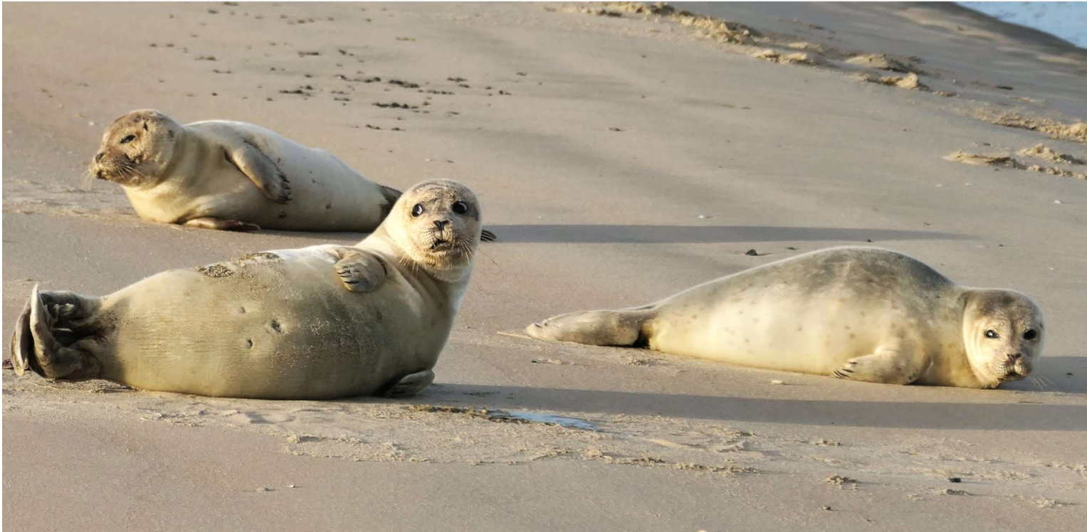
Gewone Zeehond – 24 december 2022 Katwijk aan Zee - Buitenwatering

Vanaf 9 december rustten dagelijks 1 tot 3 Gewone Zeehonden langs de Uitwatering van Katwijk (HD ea).