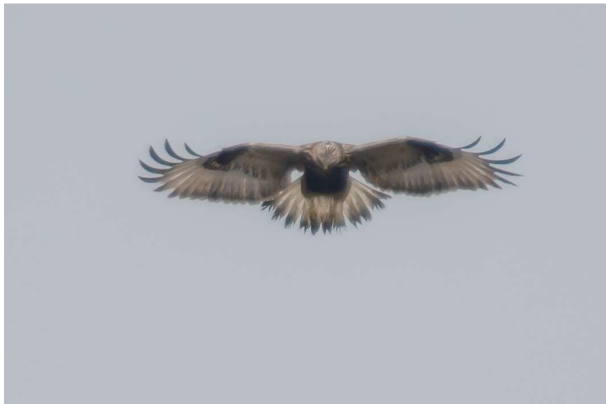
Ruigpootbuizerd – 20 november 2022 Amsterdamse Waterleidingduinen