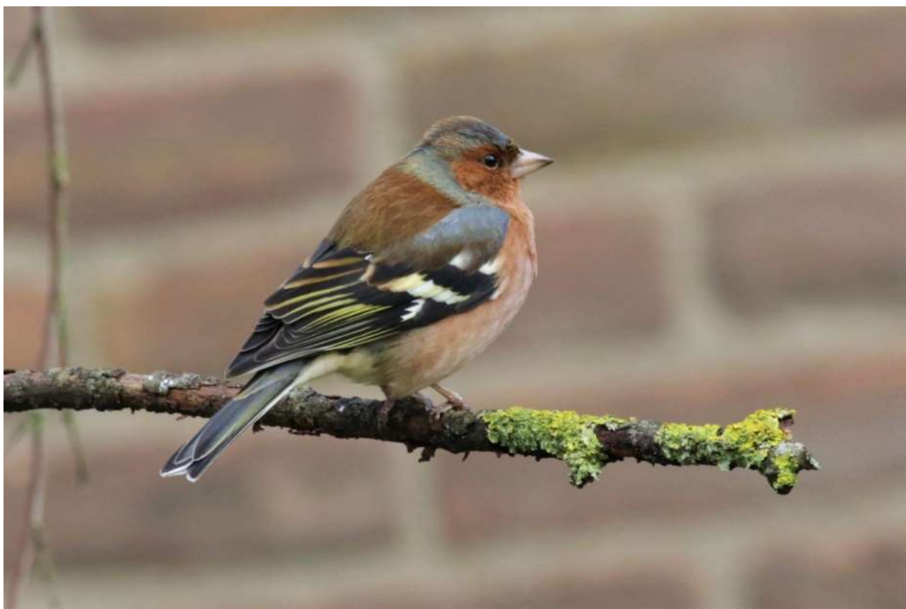
Vink – 26 december 2022 - .Noordwijk - Willem v.d. Bergh (Stichting)