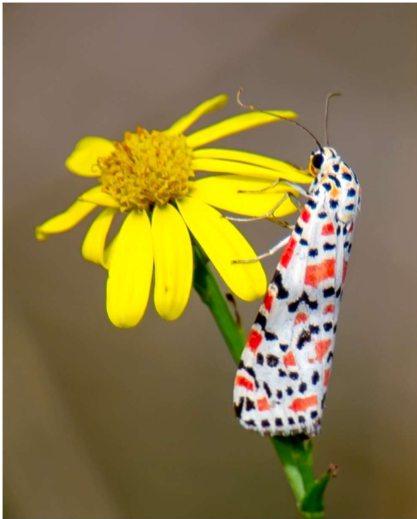
Prachtbeer -30 oktober 2022 Amsterdamse Waterleidingduinen - Gijs Kokkieshoek

Warmte in Spanje en Frankrijk en een zuidelijke wind die wekenlang aanhield zorgden voor een warme herfst. Op de zuidenwind kwamen uit Zuid-Europa ook Vale Gierzwaluwen mee. We beleefden dit jaar in Nederland een ongekende influx. Pas in 2006 is de soort voor het eerst in Nederland vastgesteld. Sinds 2018 lijkt het een jaarlijkse verschijning te zijn geworden en bereiken meerdere vogels ons land in de late herfst. In 2018 was ook de eerste waarneming van deze soort in ons waarnemingsgebied, gevolgd door nog eens vier in 2020. Bijzonder is dat deze zuidelijke soort pas verschijnt als onze eigen Gierzwaluwen weg zijn. Eind oktober is het moment dat ze ons land bereiken, op een zuidelijke stroming. In 2022 ging het daarbij om tientallen. Dat was vooral in de kuststrook. Regelmatig ging het daarbij om meerdere vogels die tegelijk aanwezig waren. Op Texel vlogen er op enig moment zelfs 7 Vale Gierzwaluwen tegelijkertijd in de omgeving van de vuurtoren op de noordpunt. In ons waarnemingsgebied vlogen er op 28 oktober drie over de Puinhoop. Dat was ook de enige dag dit najaar in ons waarnemingsgebied. Dat is eigenlijk ook wat je van een gierzwaluw, de Vale net zo goed als onze eigen, mag verwachten: zo zijn ze er ineens vanuit het niets en zo zijn ze weer vertrokken.