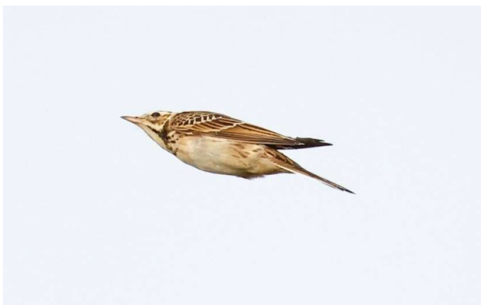
Grote Pieper -10 oktober 2022 Katwijk aan Zee - De Puinhoop

Begin oktober was er een kleine influx van Grote Kruisbekken . Dit leverde voor ons waarnemingsgebied een overvliegende vogel op 2 oktober over Noordwijk aan Zee (RE JF) en op 7 oktober 3 over de Puinhoop (GT RR). Van 2 tot 26 oktober werden er op verschillende plekken Bladkoningen gezien. De piek was in de eerste week van de maand met op 2 oktober vijf verschillende vogels (CZ ea). Op 8 oktober zat er een late Gekraagde Roodstaart in een tuin in Noordwijk-Binnen (WBo). Op 12 oktober was er een Hop aan het voedselzoeken in het Boeveld in de AWD (BK). Over de Coepelduynen vloog op 30 oktober een luid roepende Pestvogel (HL BS). Op 27 oktober was er een Siberische Tjiftjaf aanwezig in de Noordduinen bij de Duindamse Slag (MW). Van 4 tot 21 oktober verbleven er tot 3 Grote Piepers bij een enclosure in de Westhoek in de AWD (EM ea). Verspreid over