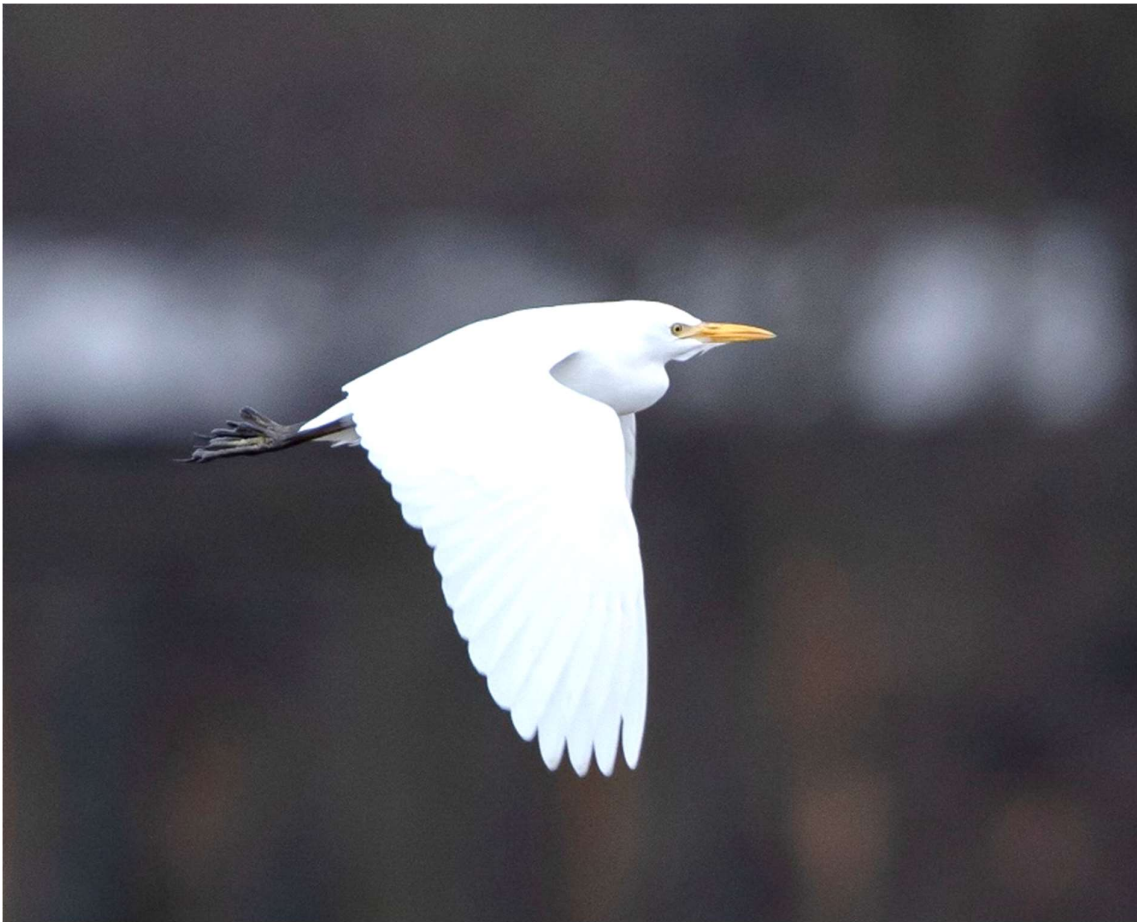
Koereiger 24 december 2022 - Noordwijk - De Klei

In de eerste helft van de maand was het met een overwegend oostenwind rustig en koud weer. Van 12 tot 19 december was er een vorstperiode. Daarna kwamen we in een zuidelijke stroming en werd het zacht weer met veel regen. Het jaar eindigde met harde zuidwestenwind en recordhoge temperaturen.