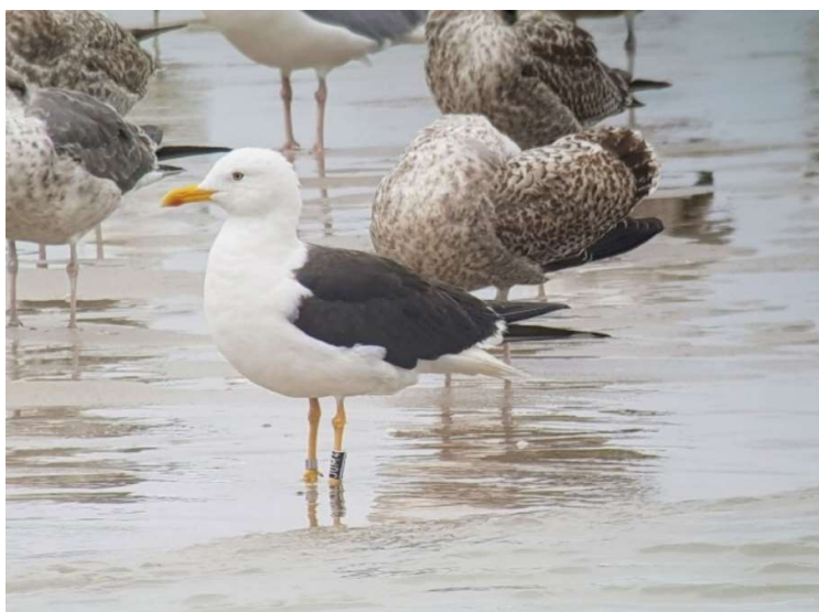
Baltische Mantelmeeuw - : 20 oktober 2022 Katwijk aan Zee - strand

De maand behoorde tot de top 10 van warme oktobermaanden. Ook viel er weinig regen. In het eerste deel van de maand werd met een zuidwestelijke stroming warme lucht aangevoerd. Af en toe draaide de wind naar noordwest en trok aan tot windkracht 5 of 6, zoals op 1 en 8 oktober. Vanaf de 18 e overheerste wind uit het zuidoosten tot zuiden, wat de temperaturen verder deed oplopen.