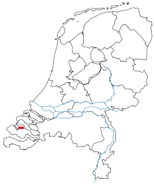
Figuur 3. Vindplaatsen van Aoroides longimerus in Nederland.

Figure 2. Aoroides semicurvatus , mandible with rod shaped last segment of palp, 18.xi.2017, Putti's Place, Oosterschelde near Goes.