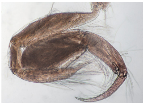
Figuur 1. Aoroides longimerus , lateraal aanzicht rechterschaarpoot mannetje met talrijke lange, geveerde haren, 9.x.2020, Kortgene, Veerse Meer. Figure 1. Aoroides longimerus , lateral view right chelipede male with numerous long, plumose setae, 9.x.2020, Kortgene, Veerse Meer.

In oktober 2020 werd door GIMARIS in samenwerking met Eurofins AquaSense in opdracht van Bureau Risicobeoordeling & onderzoek van de Nederlandse Voedsel- en Warenautoriteit een onderzoek uitgevoerd in het Veerse Meer en de Zandkreek. Een van de hoofddoelen was het samenstellen van een lijst met soorten, met bijzondere aandacht voor exoten (GIMARIS in prep.). Er werden twee voor Nederland onbekende Pacificische vlokreeften aangetroffen: Aoroides longimerus Ren & Zheng, 1996 en Erichthonius didymus Krapp-Schickel, 2013.