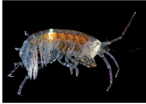
Figuur 5. Aoroides semicurvatus , habitus vrouwtje, 18.xi.2017, Putti's Place, Oosterschelde bij Goes. Figure 5. Aoroides semicurvatus , habitus female, 18.xi.2017, Putti's Place, Oosterschelde near Goes.

23.x.2020, tientallen exemplaren tussen begroeiing van pontons.