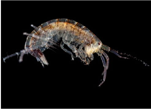
Figuur 4. Aoroides longimerus , habitus vrouwtje, 9.x.2020, Kortgene, Veerse Meer. Figure 4. Aoroides longimerus , habitus female, 9.x.2020, Kortgene, Veerse Meer.