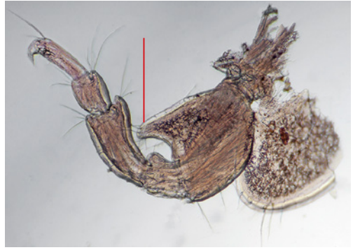
Figuur 7. Ericthonius didymus , vijfde poot met posterodistale lob aan het basissegment, 23.x.2020, Kortgene, Veerse Meer.