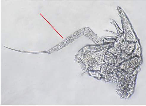
Figuur 2. Aoroides semicurvatus , mandibel met staafvormig eindlid van de palp, 18.xi.2017, Putti's Place, Oosterschelde bij Goes.

Figure 2. Aoroides semicurvatus , mandible with rod shaped last segment of palp, 18.xi.2017, Putti's Place, Oosterschelde near Goes.