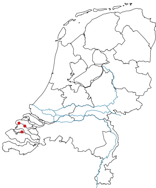
Figuur 9. Vindplaatsen van Ericthonius didymus in Nederland.