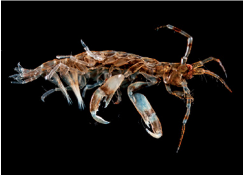
Figuur 6. Ericthonius didymus , habitus mannetje, 23.x.2020, Kortgene, Veerse Meer. Figure 6. Ericthonius didymus , habitus male, 23.x.2020, Kortgene, Veerse Meer.