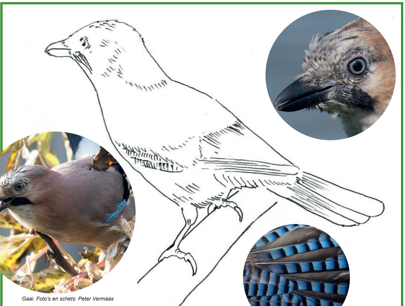
Gaai. Foto's en schets: Peter Vermaas