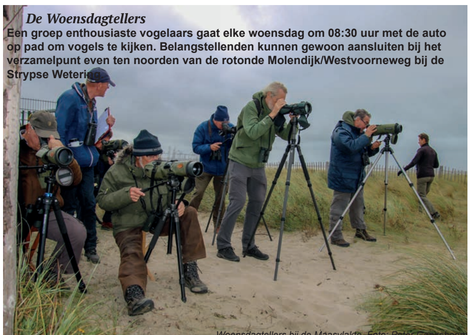
Woensdagtellers bij de Maasvlakte.

Een groep enthousiaste vogelaars gaat elke woensdag om 08:30 uur met de auto op pad om vogels te kijken. Belangstellenden kunnen gewoon aansluiten bij het verzamelpunt even ten noorden van de rotonde Molendijk/Westvoorneweg bij de Strypse Wetering.