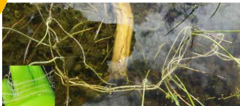
Eisnoer rugstreeppad als witte kralenketting.