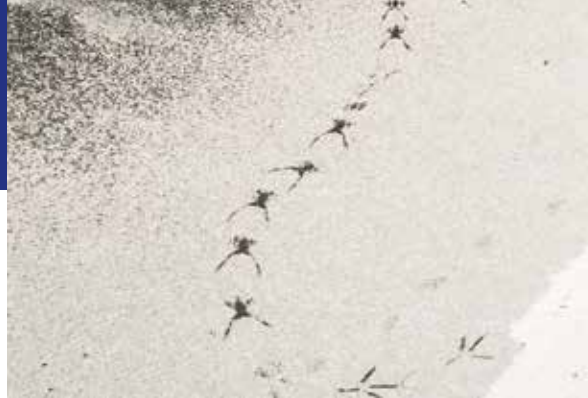
Een bevroren bruine kikker en sporen van een kikker in de sneeuw.