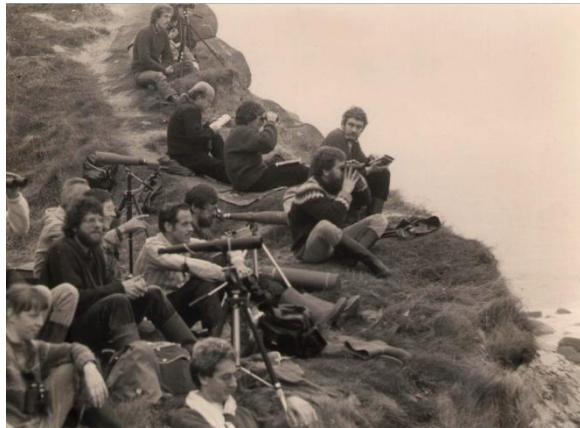
VWG-weekend op Cap Gris Nez, oktober 1983

Is daarmee alles voor iedereen toegankelijk? Het antwoord is: nee. Wat te denken van (ook historische) foto's van VWG-weekenden, excursies en projecten. Die foto's zitten nu in doosjes en fotoalbums van leden en oud-leden. Wellicht hebben enkele leden hun oude foto's gedigitaliseerd, en recente foto's zijn uiteraard alleen maar digitaal, maar ze staan ergens op een PC en gaan voor de VWG verloren als die persoon lid-af wordt of overlijdt. Wellicht is het zinvol hier iets voor te bedenken.