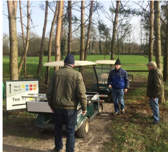
VWG-leden aan het werk

hole 2. Veel bloemen, insecten en dus ook weer vogels.