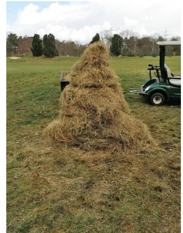
Muisenruiter op Golfclub Tongelreep

De muizenruiters, de piramides van stro en hout die her en der in de baan te vinden zijn, komen ook uit de koker van de vogelwerkgroep. Het zijn een soort hotels waar dieren de winter in doorbrengen, hoe meer diversiteit hoe beter! Wij zijn zeer blij met de samenwerking!