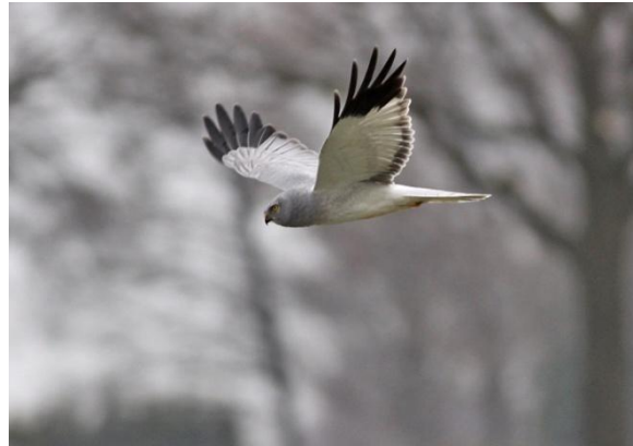
Blauwe Kiekendiefman bij Leende, 27 december 2009 (Robert Kastelijn)

wendbaarder en schakelen makkelijker over op andere prooien wanneer er weinig muizen zijn of het terrein ruiger is en dus onoverzichtelijker. Vaak kleine zangvogels."