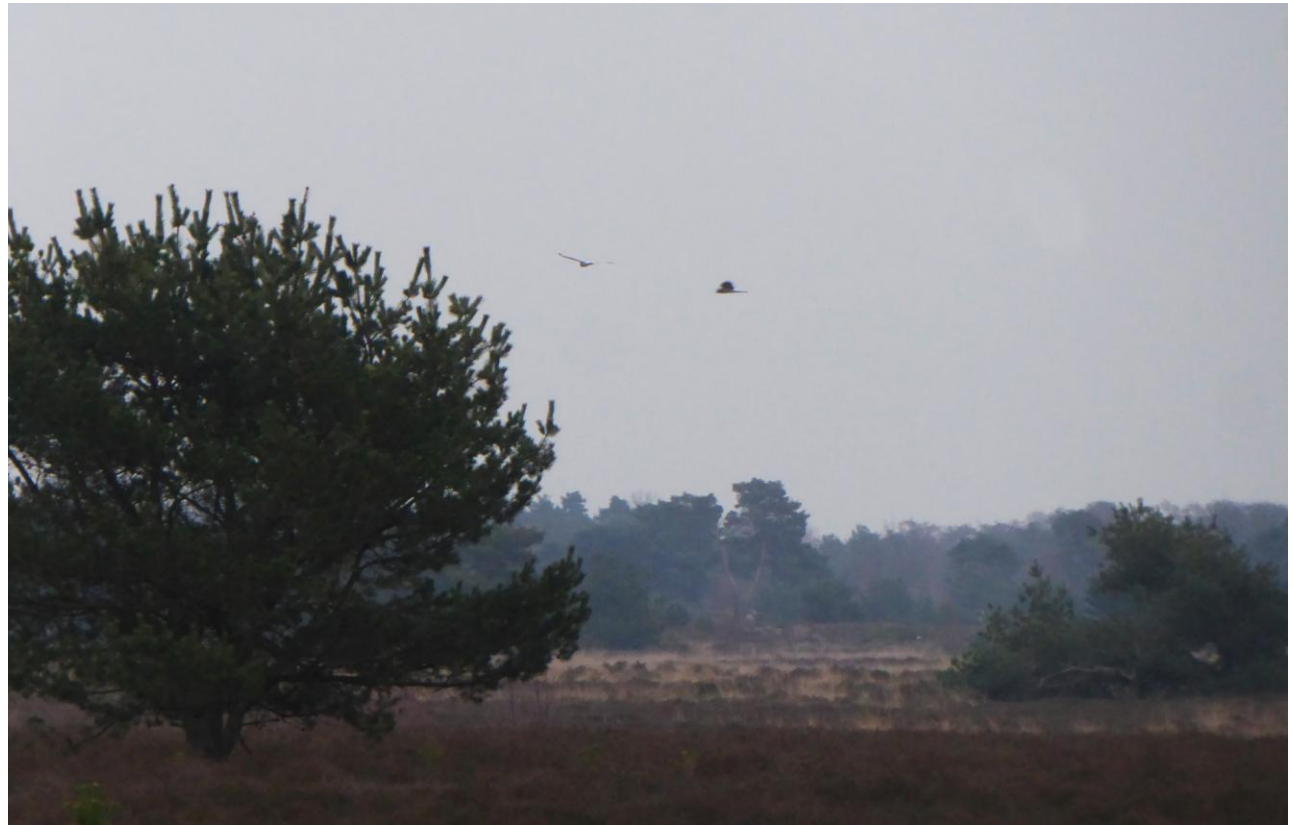
Twee Blauwe Kiekendiefmannen op de Grootte Heide, 12 februari 2023 (RvH)

In een studie van Zeeuwse slaapplekken stond dat mannetjes vaak later aankomen om gedoe met de grotere vrouwtjes te voorkomen. Nou, in mijn mini-studie was dat dus niet het geval. Ik heb maar weinig interactie met het vrouwtje gezien en ze kwamen steeds eerder aan. Gezien mijn paar waarnemingen stelt het natuurlijk niets