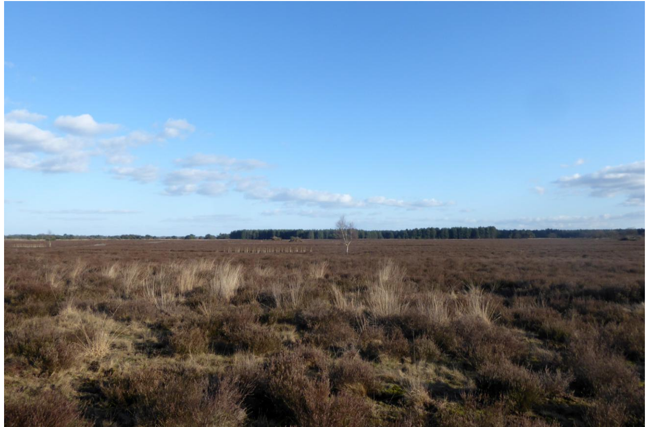
Groote Heide op 25 februari 2023