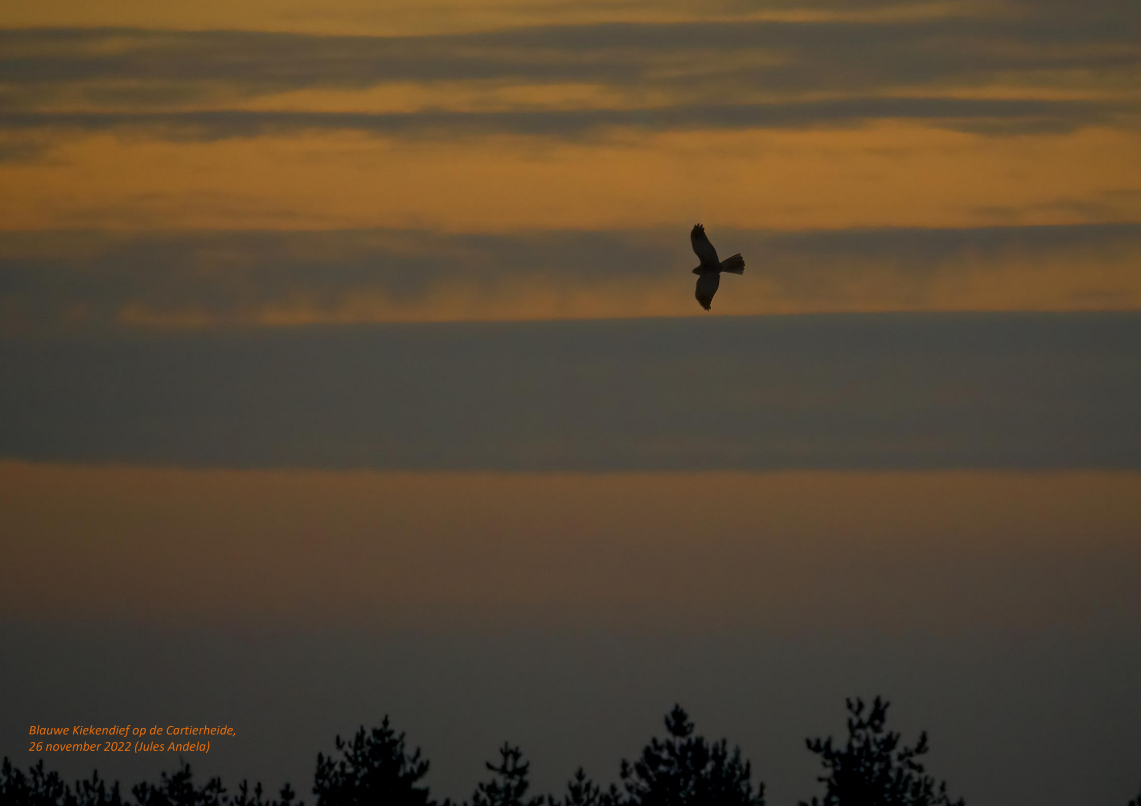
Blauwe Kiekendief op de Cartierheide, 26 november 2022 (Jules Andela)