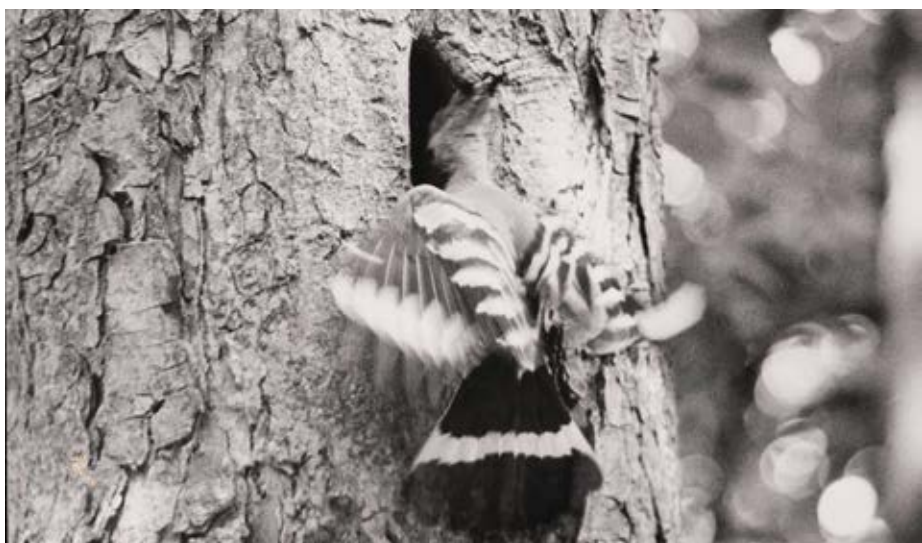
Hop bij nestholte, 't Reigersnest, Oostvoorne, 3 augustus 1952.

deel van het aantal soorten op die lijst. Even veelzeggend is het dat de veldleeuwrik, zomertortel, huiszwaluw, gekraagde roodstaart, spotvogel en de grauwe vliegenvanger in 1954 volop te zien waren, maar dat zij in 2004 ontbraken. Van de 37 soorten die op 8 juni 2004 niet zijn waargenomen, waren er een halve eeuw geleden nog 29 soorten broedvogel. Ik besef dat ik met deze opmerking de indruk kan wekken dat het op Voorne met de vogels helemaal mis is. Dat is volstrekt onjuist. Volgens de