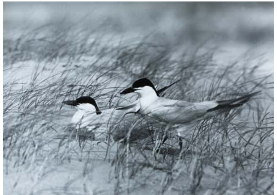
Adulte Lachstern, Haringbuizen, Noord-Holland, augustus 1999.

Groene Strand en als slot nog een poos speuren naar lachsterns van het Zuidslak op De Beer. Dat gebeurde vanaf de destijds sinds een paar jaar in gebruik zijnde Brielse Dam. Het lukte niet ze te zien, maar later in de maand wel. Terug op IJsselmonde verkozen wij de route over de Vondelingenweg, met stops bij de uitgestrekte opspuitterreinen tussen Waalhaven en de Tweede Petroleumhaven. Dit was ons eldorado. Dat leverde de eerste futen op van die dag, de daar broedende geoorde futen en zwarte sterns en nog een paar soorten die nog hadden ontbroken op de daglijst. Om de vergelijking zuiver te houden zijn deze 'Vondelingenweg-soorten' niet opgenomen in een overzichtslijst met waarnemingen van vijftig jaar terug en van 2004 (zie Tabel 1). Wij vormden een tevreden viertal toen wij 's avonds in Rotterdam terugkeerden. Deze dag had 91 soorten opgeleverd, met als hoogtepunt een hop, die zowel gehoord als gezien was. Verder nog een grauwe klauwier, een mannetje grauwe kiekendief, 25 subadulte dwergmeeuwen op het Brielse Meer en, onderstreept in het dagboek, op zee vier knobbelzwanen, die een halve eeuw geleden kennelijk ongewoon waren. Dinsdag 8 juni 2004 had beter weer in petto dan een halve eeuw eerder, maar dat was ongeveer het enige dat gunstiger uitpakte. Ik had niet gerekend op een fantastische vogelexcursie, maar hoopte toch iets