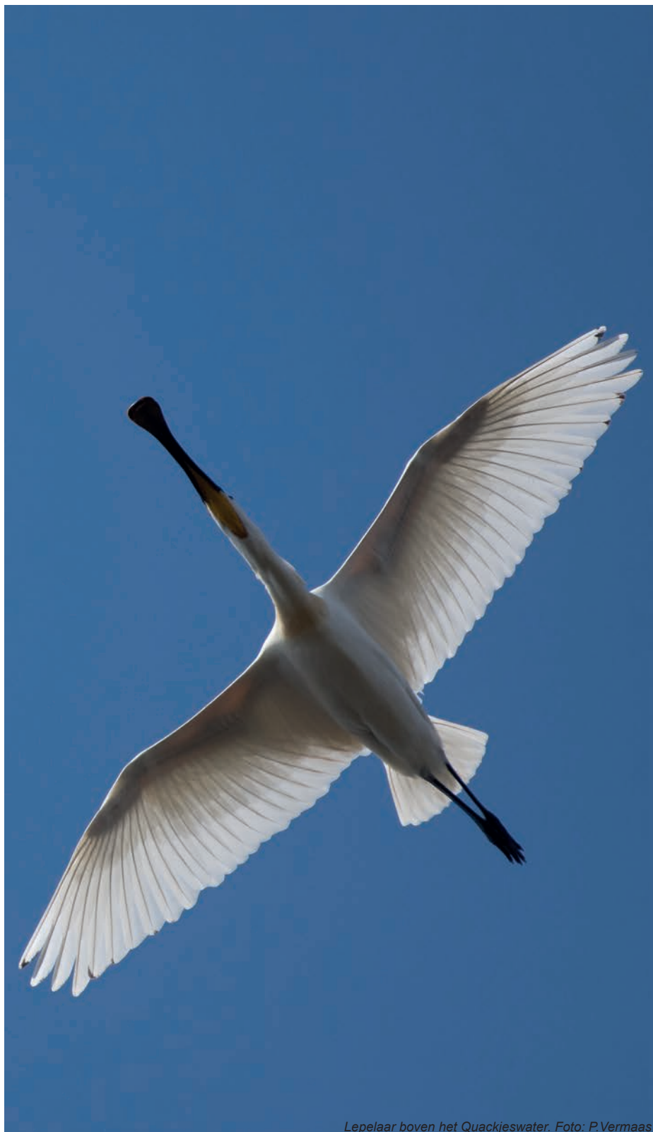
Lepelaar boven het Quackjeswater.

Maar nu met de toevoeging dat ik daar in speciale gevallen van af mag wijken. Wel heb ik me voorgenomen om te proberen alleen vrouwtjesmuggen die mij gebeten hebben iets aan te doen. Of nog beter zoveel mogelijk proberen niet gebeten te worden. Beter voor mij en zeker voor de mug!