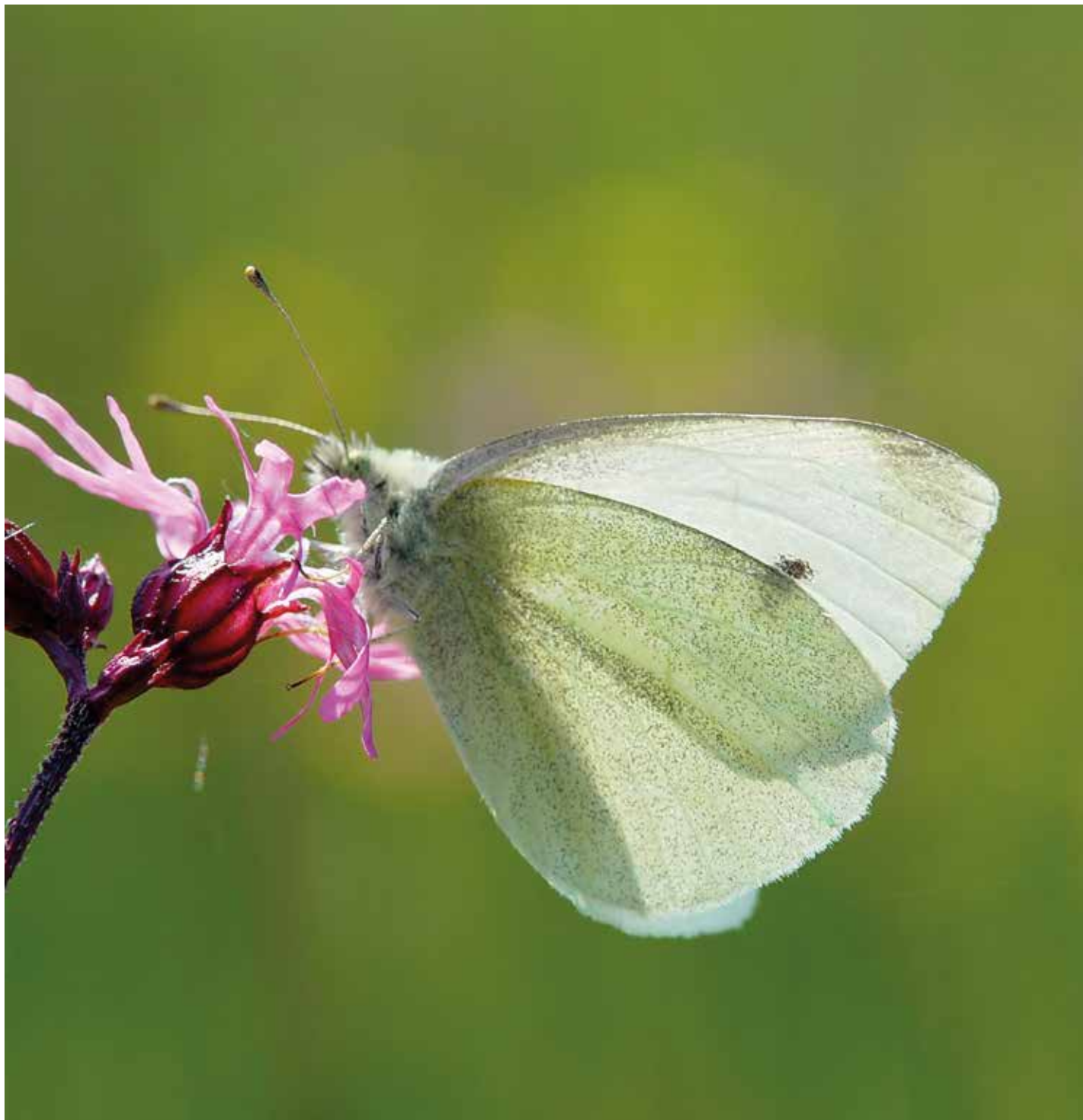
Het klein koolwitje heeft meerdere generaties per jaar.

voor alles corrigeren, maar voor 2022 hebben we het toch geprobeerd (figuur 2). Omdat routes in landelijk gebied vrijwel allemaal in wegbermen liggen, hebben we alleen die meegenomen. Maar ook in natuurgebieden liggen routes vaak in de beste delen. Daar is lastig voor te corrigeren, bezie de aantallen in figuur 2 dan ook als de bovengrens. De onzekerheid rond de schatting laten we voor het gemak even weg. Een schatting van het totaal aantal vlinders is veel lastiger, juist omdat niet alle vlinders even oud worden