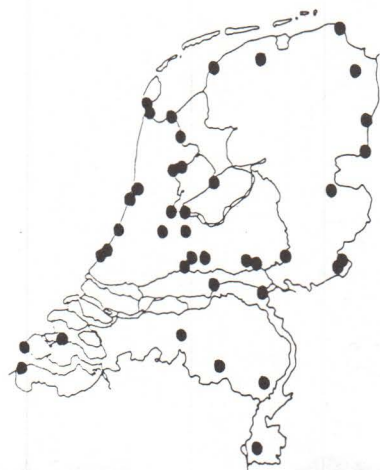
Figuur 2. Ligging van telposten welke de laatste jaren actief zijn geweest.

In figuur 2 wordt een overzicht gegeven van telposten die de laatste jaren actief zijn geweest. De LWVT kan nieuwe tellers en telposten goed gebruiken, zeker in gebieden waar tot nu toe weinig geteld is. Sommige bestaande telposten kunnen bovendien best wat versterking gebruiken. Geïnteresseerden kunnen meer informatie krijgen via de handleiding, welke te verkrijgen is bij de secretaris van de LWVT: Cees Witkamp, Brugstraat 18, 4131 AX Vianen.