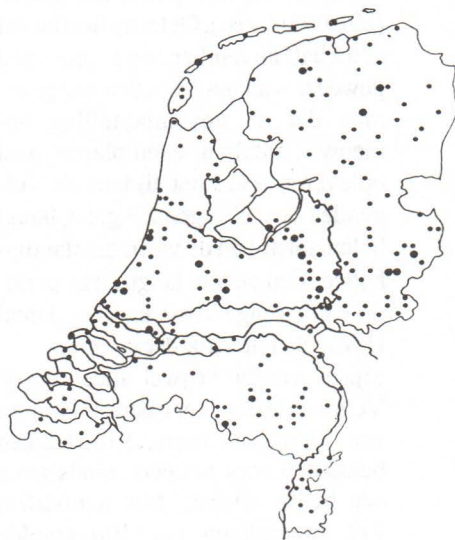
Figuur 1. PTT-routes augustus 1990. Kleine stip: 1 route, grote stip: 2 of meer.

Voor steltlopers is de augustustelling een mooie periode. De trek van Watersnippen bijvoorbeeld is in de tweede helft van augustus goed op