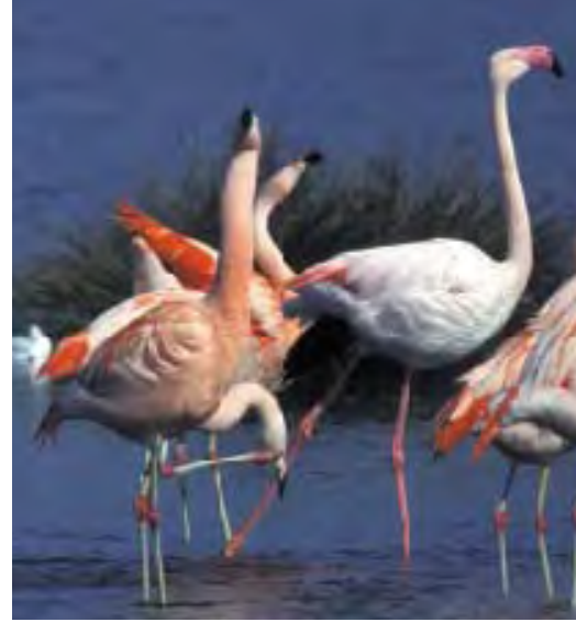
Herkenning van flamingo's in Nederland

Flamingo's kunnen het hele jaar door in ons land worden waargenomen, maar in het broedseizoen (eind april-juni) zullen de meeste vogels in de kolonie in Duitsland verblijven. De weinige vogels die dan nog in Nederland worden gezien, betreffen waarschijnlijk niet-geslachtsrijpe dieren. Flamingo's nemen namelijk pas vanaf hun vijfde levensjaar aan het broedproces deel. In 1996-2000 werd er niet met succes gebroed in het Zwillbrocker Venn, door een lage waterstand en de daardoor toegenomen predatie. In die periode werden ook in het voorjaar relatief veel flamingo's gemeld in ons land. Normaal gesproken verlaten de vogels vanaf begin juli het Zwillbrocker Venn. De groep valt dan vaak uiteen en een deel trekt via de IJssel of de Oostvaardersplassen naar de Friese IJsselmeerkust en het Lauwersmeer-gebied. Vooral de Steile Bank is geliefd bij alle soorten flamingo's. Hier verblijven de vogels doorgaans van juli tot in oktober. Andere gebieden, waar dan