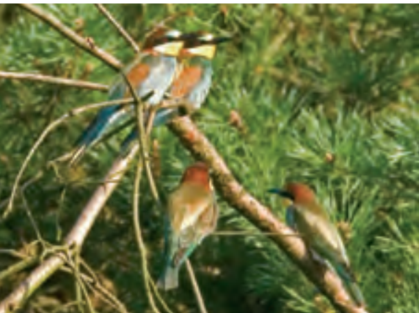
(Boven) Kuifleeuwerik op nest met 4 eieren, Veldhoven, 8 april 2006.

In het laatste weekend van oktober kwamen de districtskoördinatoren van het Landelijk Soortonderzoek Broedvogels (LSB) bij elkaar aan het Veerse Meer. Behalve vergaderd werd er natuurlijk veel gesproken over vogelnieuwtjes. Hierop is de eerste impressie hieronder gebaseerd. In het broedvogelrapport, dat begin 2008 verschijnt, zal alles gedetailleerd na te lezen zijn.