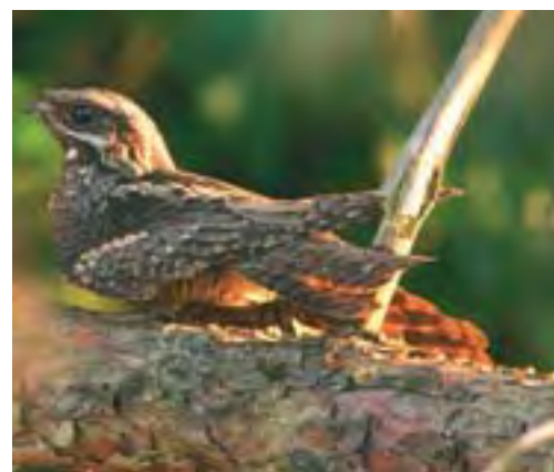
Nachtzwaluw. Linksboven bijna vliegvlug jong, rechtsboven alerte oudervogel.

Aan tellers wordt gevraagd om het uitgekozen gebied tweemaal tussen half mei en eind augustus in de avondschemer te bezoeken. Kies hiervoor een rustige avond uit met niet te lage temperaturen. De zangpiek kan kort of lang duren en wat vroeger of later beginnen, afhankelijk van het weer en de bewolking; in het algemeen is de periode van zons- ondergang tot 1-2 uren erna het meest geschikt. De locatie van waarnemingen cq. territoria dient exact te worden aangegeven op een kaart. Voor internetgebruikers wordt hiervoor een invoersysteem gemaakt op