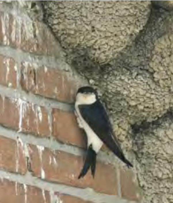
Huiszwaluw bij nest (Hans Gebuis)