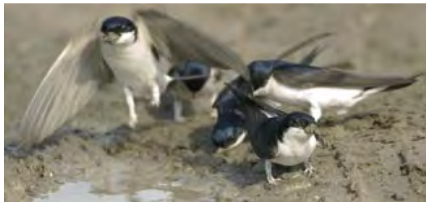
Huiszwaluwen (Hans Gebuis)