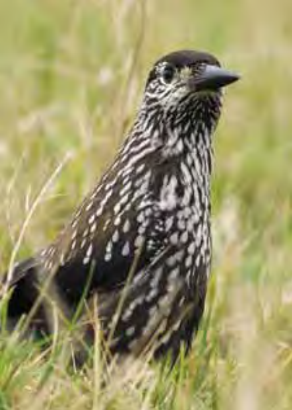
Notenkraker, Horst (Lb), 31 oktober 2008.