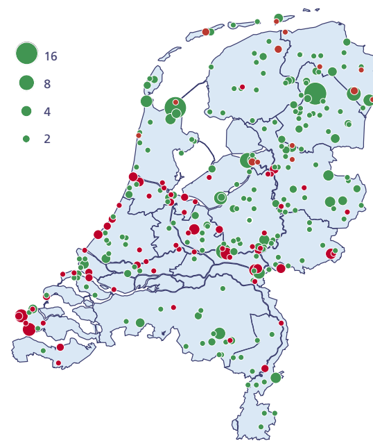
Figuur 2. Verspreiding van ter plaatse verblijvende (groen) en trekkende (rood) Notenkrakers in 1989-2008 (som per atlasblok over alle jaren).

Elders in Europa werden eveneens Notenkrakers gemeld en Britse vogelaars keken hoopvol naar het vasteland. In september werden Notenkrakers gezien in Noorwegen (groepen) en Denemarken. Op trekposten in Noordwest-Duitsland werden in oktober 4 solitaire Notenkrakers geteld. In Vlaanderen werd een 'Siberische' Notenkraker gemeld vanaf 29 oktober bij Leuven. Uit het oosten van Europa kwamen geen berichten van grote verplaatsingen, al waren bijvoorbeeld in Hongarije de aantallen tweede helft oktober wel hoger dan normaal (www.birding.hu). Het blijft voorlopig dus nog wachten op een echte invasie van deze magnifieke soort...