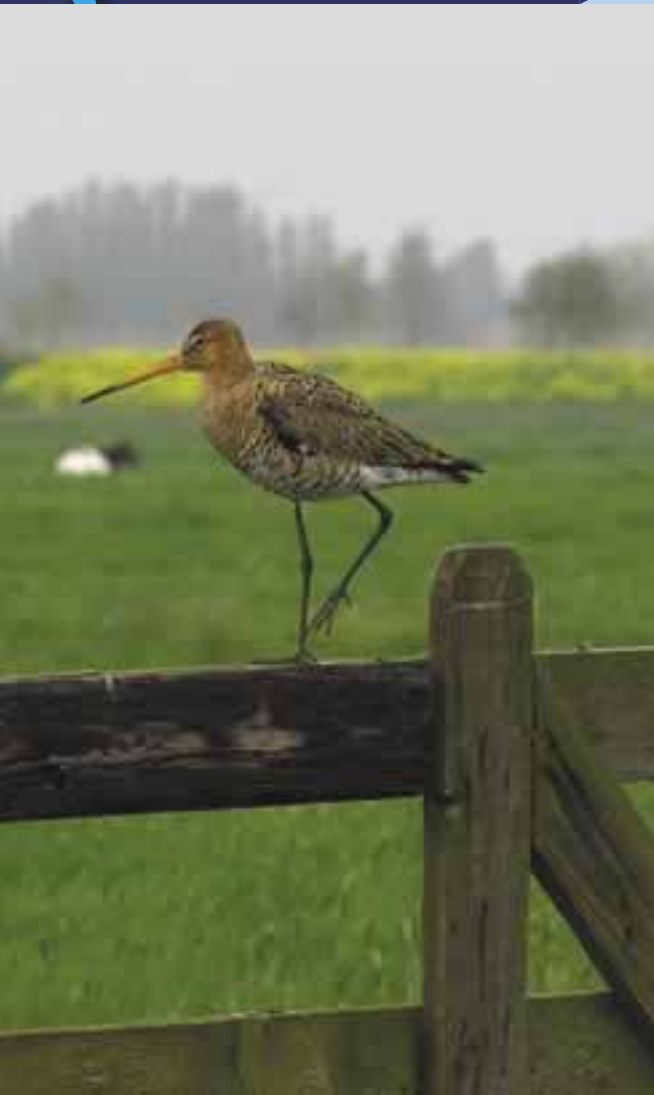
Grutto op hek in de Alblasserwaard.