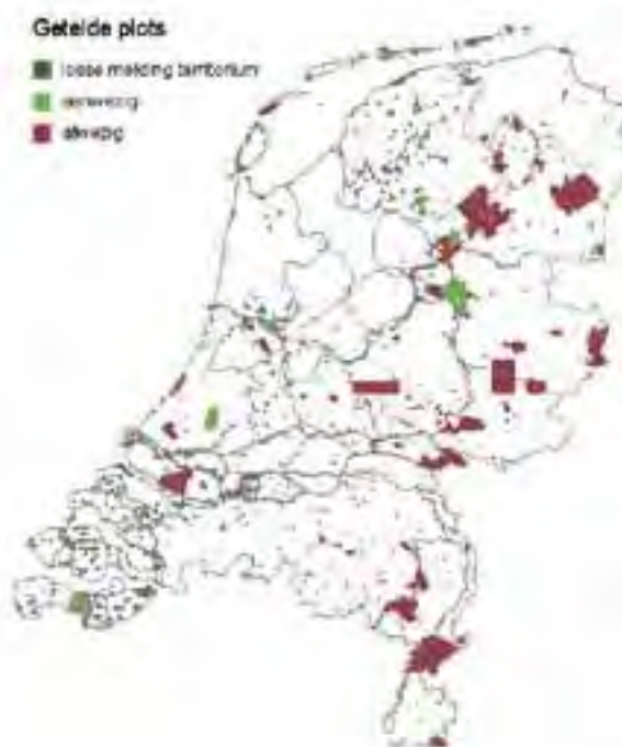
Figuur 2. Gebieden waar in 2006-2009 Bruine Kiekendieven werden geteld.

De eerste Bruine Kiekendieven zijn inmiddels alweer terug uit westelijk Afrika. Op dit moment zijn evenwel duizenden Bruine Kiekendieven nog onderweg naar West-Europa en vliegen misschien op dit moment over de Pyreneeën of de Middellandse Zee om dadelijk in gebieden zoals de Vendée of de Camargue even op krachten te komen. Next stop: Nederland! Niet wetende dat Nederland dit jaar in het teken staat van deze geweldige vogel. Samen met honderden, zo niet duizenden enthousiaste vogelaars gaan we proberen om zo veel mogelijk potentiële broedgebieden geteld te krijgen. Zoals altijd staat of valt het succes van de extra aandacht voor een Soort van het Jaar met uw beslissing om mee te doen. Uw hulp kunnen we dus goed gebruiken!