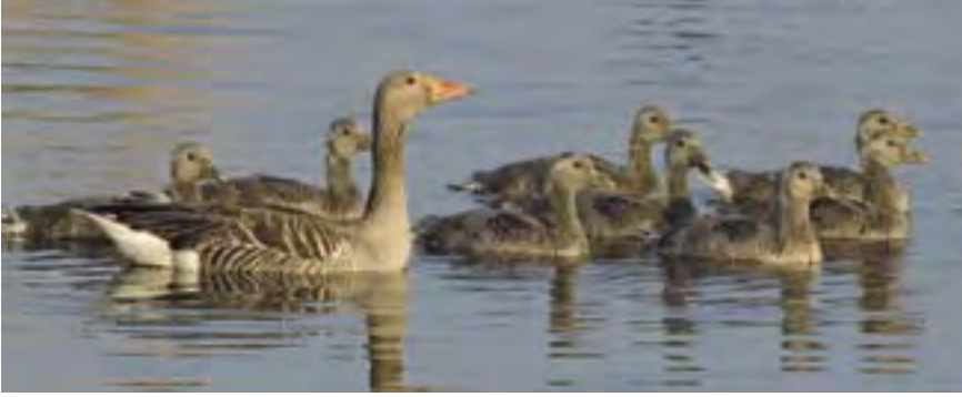
Grauwe Gans met jongen.

cies herbergden ook in 2005, bij de landelijke inventarisatie van broedende ganzen, de grootste aantallen (Voslamber et al. 2007, Limosa 80: 1-17).