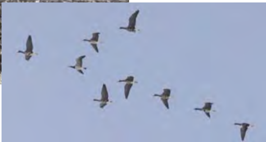
Kolganzen met een Brandgans trekken over de telpost de Horde, Lopik, 18 december 2009.

reisden, zagen overal aan de horizon massa's Kolganzen pal naar west vliegen.