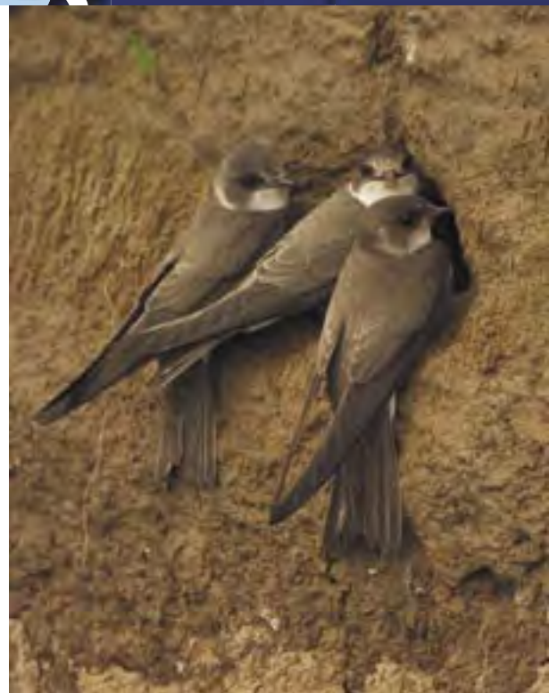
Oeverzwaluw in kolonie in de Ooijpolder, 3 mei 2006.

In Drenthe werd landelijk gezien het grootste verlies vastgesteld. Voor deze provincie kon gebruik worden gemaakt van 66 kolonies. Vier kolonies werden verlaten, zoals het Kleuvenveld bij Taarlo. Hier zaten in 2004 nog 47 paren en in 2008 21. Ook in het Meerstalblok viel de kolonie gevoelig terug naar 35 nesten (91 in 2008). Bij Speelstad Oranje was het met een achteruitgang van ruim 60% al niet veel beter. De kolonie telde er in 2009 niet meer dan 23 paren. Het zuiden van Limburg zat ook in de mineur met een afname met 7% (steekproef 60 kolonies). Met name in Eijsden-dorp (van 36 paren in 2008 naar 13 in 2009) en Lerop-dorp (van 43 naar 20) deed de Huiszwaluw het om onbekende redenen slecht. Ondanks het gemiddeld slechte nieuws uit deze provincies was er ook