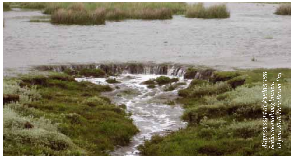
Water stroomt de kwelder van Schiermonnikoog binnen. 19 juni 2010.

Figuur 1. Alle Natura 2000-gebieden waar voor vogels instandhoudingsdoelstellingen gelden zijn op een kaart te selecteren. De gegevens worden vervolgens voor één gebied in tabelvorm getoond, maar kunnen bij de meeste soorten ook als grafiek worden bekeken. Tabellen en figuren zijn voor eigen gebruik als excel werkblad te downloaden (mits bronvermelding in acht wordt genomen) of als pdf-document te printen. Een indicatie van de begrenzing van het gebied is eveneens als pdf beschikbaar. Let bij gebruik en interpretatie van de gegevens op de uitleg die onderaan de tabellen en figuren wordt gegeven.