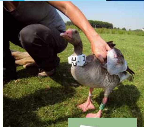
GPS-logger ganz met witte halsband 332.

Bij deze willen we iedereen die ganzen met halsbanden en/of pootringen ziet vragen deze te melden via de website www.geese.org . De ringgegevens en de overige tot dan toe gedane waarnemingen kunnen hierop direct worden bekeken. Als er problemen zijn met het inloggen of invoeren zijn wij uiteraard steeds bereid u daarbij te helpen.