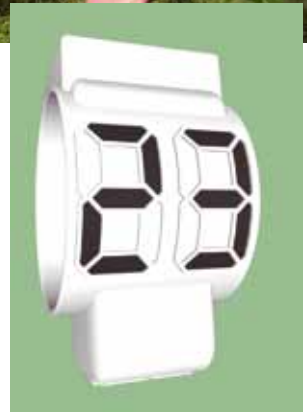
Voorbeeld van inscriptie op witte GPS-logger halsband.