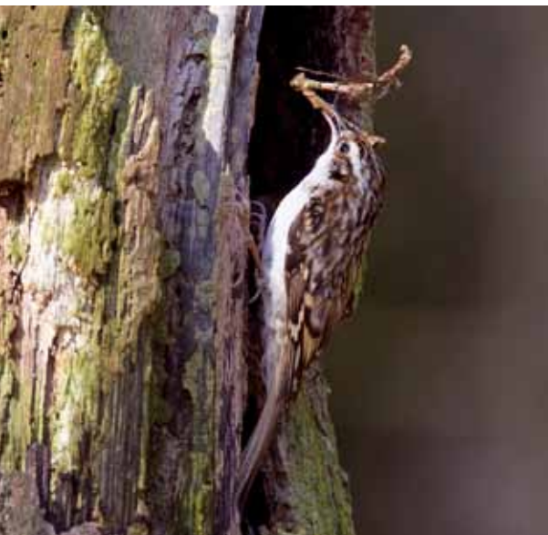
Kortsnavelboomkruiper met nestmateriaal bij mogelijke nestplaats, de Hamert, 22 maart 2011.